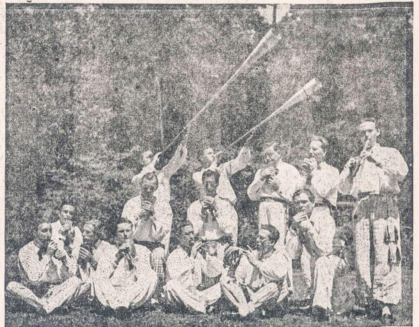
Čiurlioniečių liaudies instrumentų orkestras 1950 m. Clevelando Kultūrinio darželio šventėj