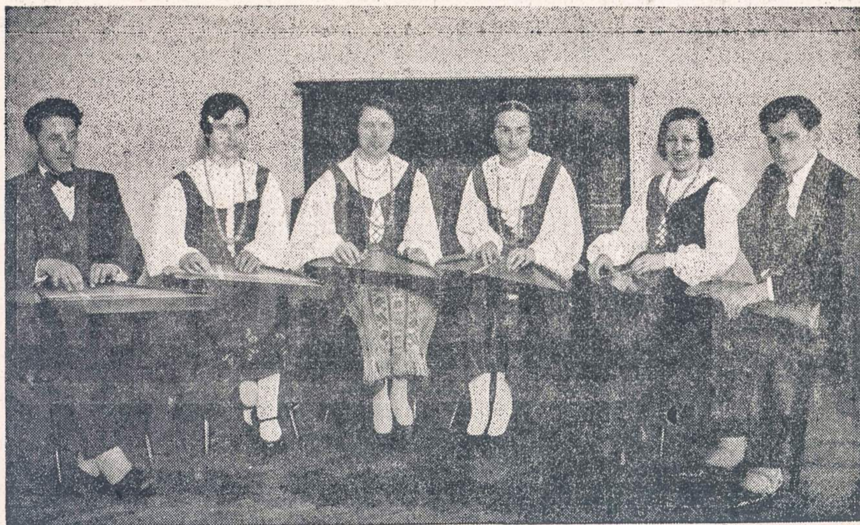
Čiurlionio Ansamblio kanklininkai ir kanklininkės