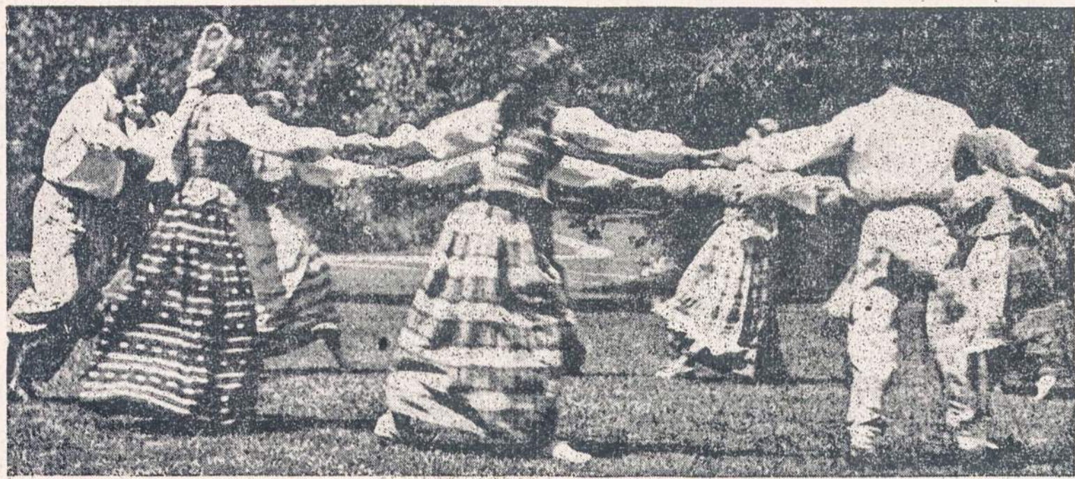
Čiurlionietės šoks Naujienu koncerte

Čiurlionietės šoka "šustą" "Pasaulio Tautų" iškilmėse amerikiečių visuomenei Clevelando kultūriniuose darželiuose 1951 m. vasarą. Taip pat dalyvaus Naujienu koncerte lapkričio 14 dieną Sokolų salėje, 2337 So. Kedzie Avenue.