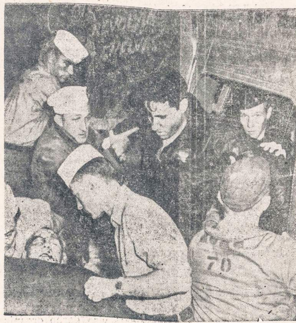
ELIZABETH, N. C. — Čia į jūrą nukrito laivyno sargybos lėktuvas. Žuvo vienas to lėktuvo įgulos narys, o kitus keturius išgelbėjo kranto sargyba.

ti nelaimėje? Beveik visi įsikūrusieji Amerikoje ar kituose kraštuose nėra jau tiek "biedni", kad negalėtų paaukoti likusių tremtinių šalpai vieno kito dolerio, rūbo ar avalynės. Mažiau varkars ar savaitgaliais išmeskite "šatų", apsieikime be "išgėrimo" atsilankius pas kaimynus, atsakykite bereikalingų "neumatytų" smulkių išlaidų ir sutauptysimė sumą, kuri nepakenkė mūsų biudžetui, leis paaukoti laukiantiems iš Balf'o paramos Vokietijoje ar kitur. Visi patikite, kas sumaterialėjo, kad, esą, negaliu, nes neturiu santaupų, mažai uždirbu, viskas brangu ir vos ne vos suvedu galus su galais, neturi pagrindo, neišlaiko kritikos. Kaip skelbiama spaudoje: aukok kiek gali, aukok mažai, bet ne lik neaukojęs, atseit, nepasidaryk tautinės tradicijos priešas, laužytojas ir jos išniekintojas. Neaukok abejotiniams tikslams, kur vienas "garbingas" visuomenės veikėjas pasiima ir išsimonių — "visuomeninį" — kur tokie "veikėjai" dirba. Ten patekusi nors mažiausia auka yra teisingai paskirstoma ir atliksime "nepastebėtai" arba neatbukime nugaros šalpai, o pasirodykime dosnūs tavernai.