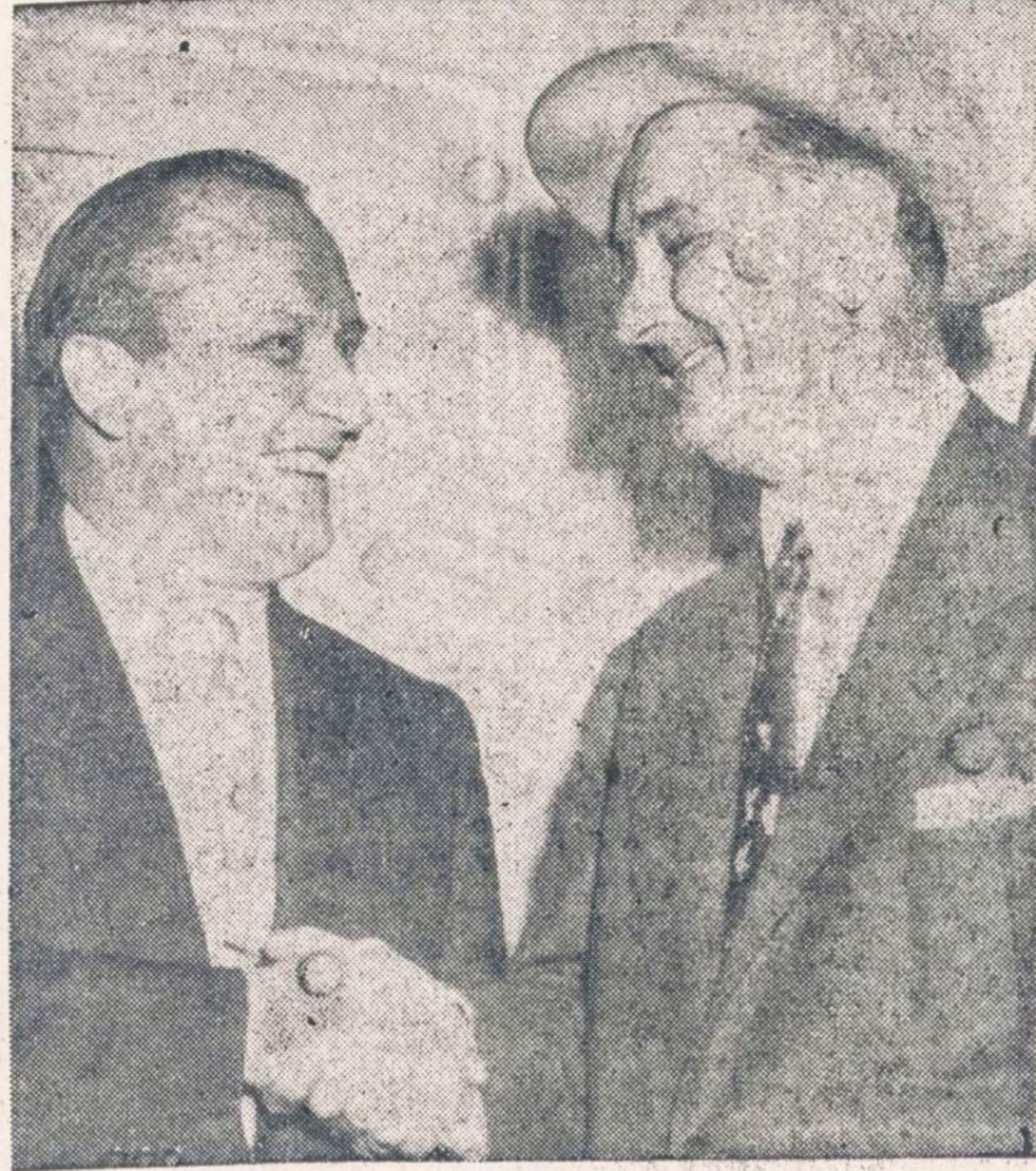
Kongreso demokratų vadai aplankė Baltuosius rūmus, kur jie turėjo pasitarimą su prezidentu Eisenhoweriu ir republikonų lyde- riais. Senato daugumos lyderis William Knowland (kairėje) šifrai sveikina sen. Lyndon Johnson. Kongresui susirinkus po Nau- jųjų metų, Johnson, kuris yra demokratas iš Texas, užims Know- lando vietą. Vadinasi, jis bus daugumos lyderis Senate, kadangi demokratai sudarys daugumą.

Stalino laikais, ministerio pir- mininko ir partijos centro komi- teto sekretoriaus pareigos buvo viename Stalino asmeny. Stali- nui mirus ir likvidavus Beriją, dabar šią valdžią padalyta tarp Malenkovo ir Chruščevo.