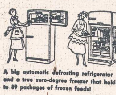
A big automatic defrosting refrigerator... and a true zero-degree freezer that holds up to 89 packages of frozen foods!

After Small Down Payment Two separate appliances in One cabinet!