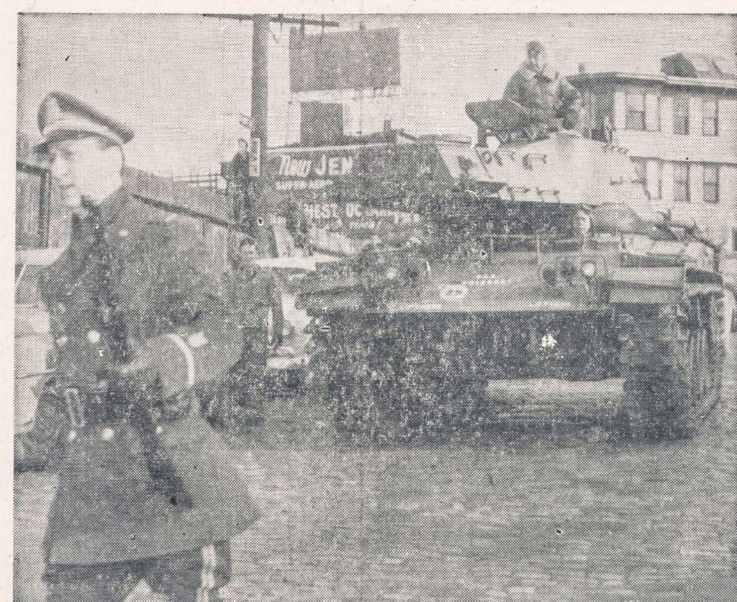
CHARLESTOWN, MASS.—Valstybės kalėjime keturi kaliniai pasigavo penkis sargus ir laiko juos kaipo įkaitus. Kaliniai reikalauja, kad jiems būtų suteiktas saugus pabėgimas. Priešingu atveju jie grumsio įkairiu nužudymu. Į kalėjimą bus prisiūstas sustiprinimas ir net tankas atgabentas. Kalėjimo vadovybė nėra linkusi su kaliniais derybas vesti dėl paliovosavimo sargų, kuriuos kaliniai laiko įkaitais.