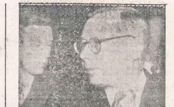
A'sak. Redaktorius: BE. KETURAKIS

ROOSEVELT FURNITURE CO. 2310 W. ROOSEVELT ROAD Tel.: SEeley 3-4711 Krautuvė atidaryta sekmadieniais nuo 11 iki 4:30.