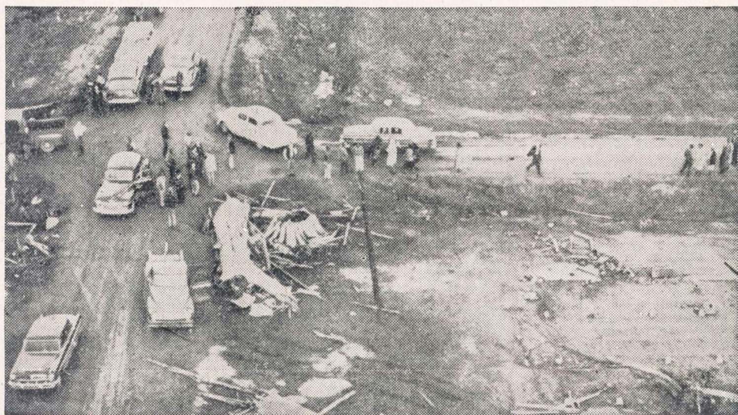
Mississippi, Arkansas ir Alabamoje siautė nepaprastis viesulas-tornado, kuris pradžioje 60 mylių ruožu. Daugiausia nukentėjo Mississippi valstybė. Kiek žinoma, žuvo 29 žmonės, o sužeistųjų skaičius siekia per šimtą. Nuotraukoje parodomas Commerce Landing (Miss.) mieste išgriautas mokyklos pastatas, kur žuvo mokytoja ir keli mokiniai.