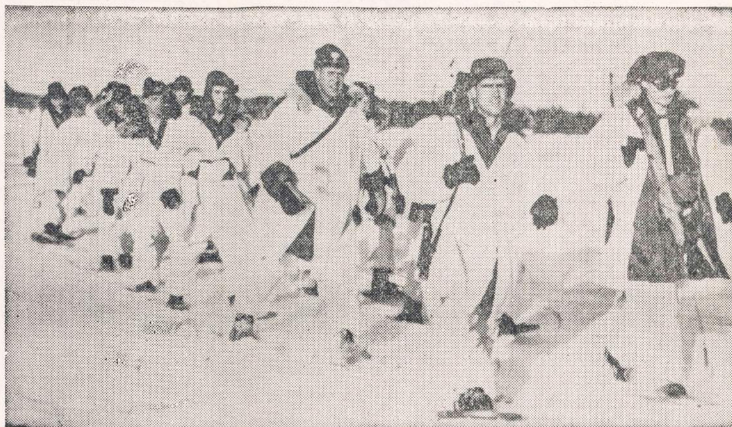
Amerikos parašiutininkų pratimai Aliaskoje, Talkeetna apylinkėje. Pratimuose dalyvauja 1,800 karių.