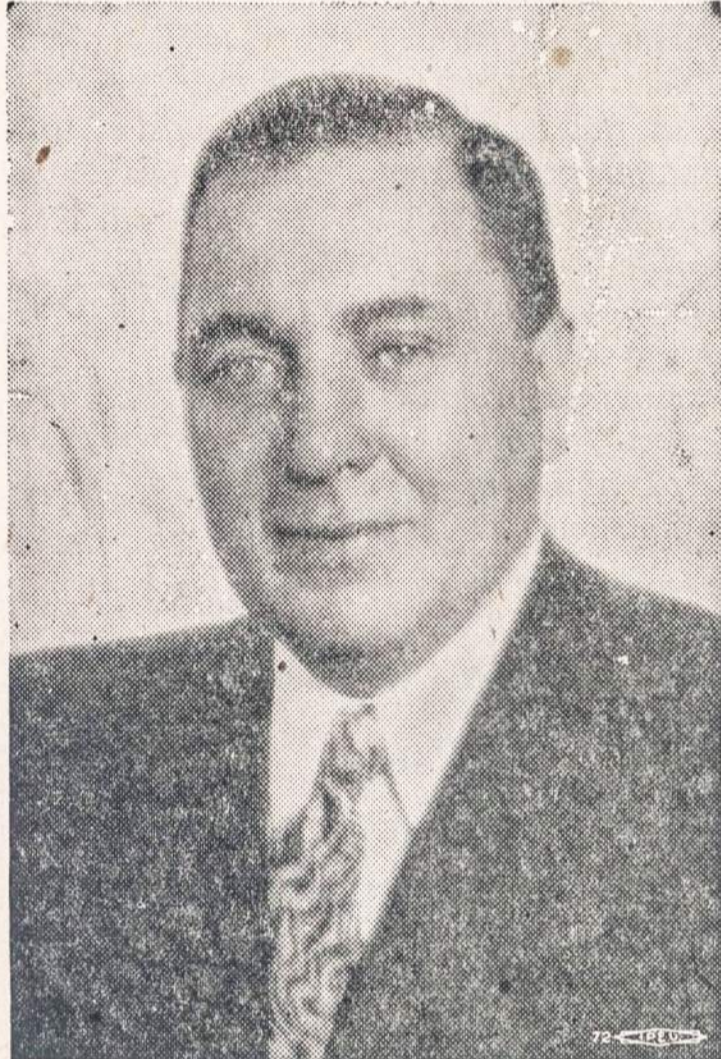
RICHARD J. DALEY