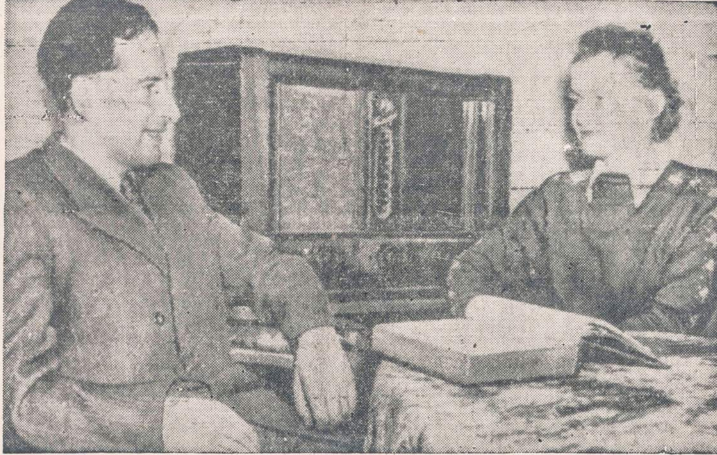
Bruno Pontecorvo, įžymus fizikas, kuris 1950 m. pasiūlyo iš Anglijos ir nuvyko į Rusiją, nusivėzdamas išgautas paslaptis apie atominę bei vandenilio bombų gamimą. Dirbdamas anglų mokslo įstaigoje, jis tarnavo Maskvai, išdavindamas atominės bombos gamimo paslaptis. Ši nutrauka buvo nuimta Maskvoje. Kartu su Pontecervo yra ir jo žmona.

BELGRADAS, Jugoslavija. — Maršalas Tito, Jugoslavijos diktatorius, matyti, nepajėgias patatyti atominį bombų, paragino didžiūnias valstybes jas uždrausti ir sunaikinti. Jo šalis eisianti prie atominės energijos panaudojimo tik taikiems tikslams. Kalbėdamas "parlamente", jis pranašavo liūdną pasaulio likimą, jeigu kiltų visuotinis karas su šiais baisiais ginklais.