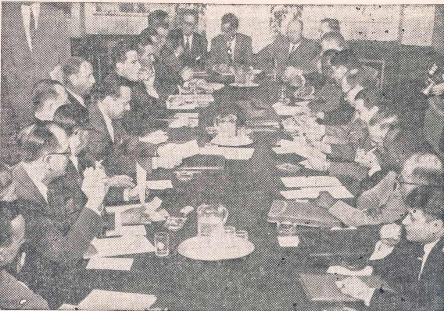
Fordo kompanijos (kairėje) ir unijos pareigūnai pradėjo Detroito derybas dėl kontrakto atnaujinimo. Derybos gali užtrukti ilgą laiką. Svarbiausias derybų punktas — tai garantavimas darbininkams metinio atlyginimo.