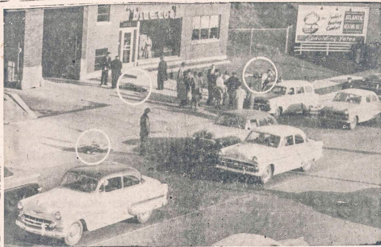
Trys mergaitės buvo užmuštos ir dvi sužeistos, kai vairuotojas nekontroliuojamas automobilis smarkiai užvažiavo ant šaligatvio. Tai įvyko Buffalo (N. Y.) mieste. Apskaičiuojama, kad automobilis važiuavo 70 mylių per valandą greičiu. Vairuotojas, kuris išliko visai sveikas, buvo areštuotas. Jam keliami kriminalinė byla.