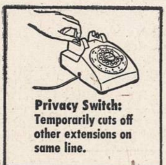
Privacy Switch: Temporarily cuts off other extensions on same line.