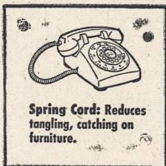
Spring Cord: Reduces tangling, catching on furniture.

Priemonės įtaisyti dar patogesnį telefoną Jūsų namuose