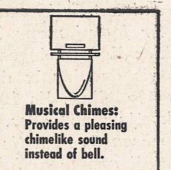
Musical Chimes: Provides a pleasing chime-like sound instead of bell.