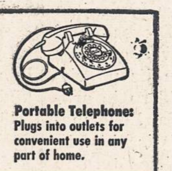
Portable Telephone: Plugs into outlets for convenient use in any part of home.