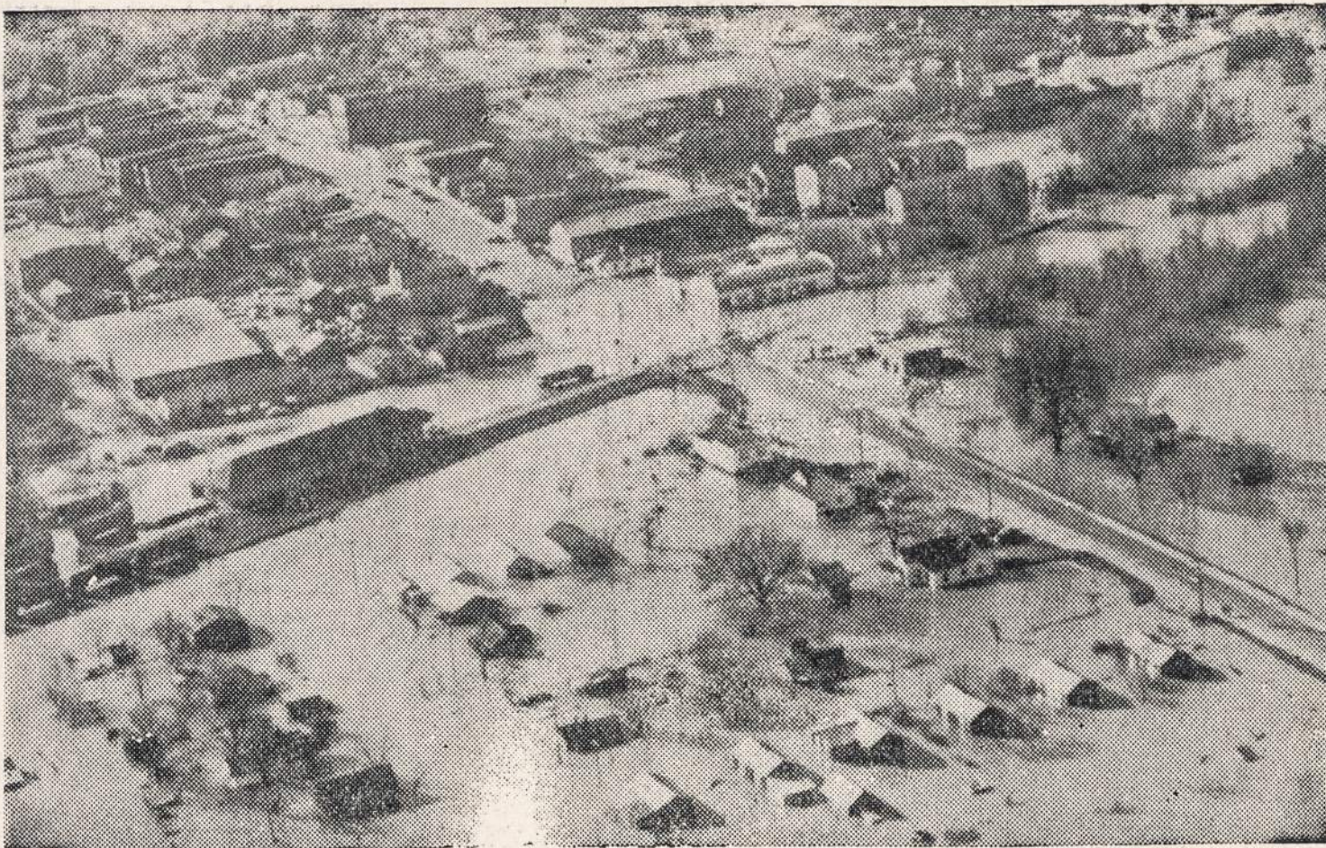
Tombigbe uosės išsiliejęs prie Aberdeen (Miss.) priverstė tūkstančius gyventojų apeisti savo namus

Buvę tremtiniai, nepamirškite likusių niūriose stovyklose savo draugų. Bent viena karta metuose aukokite jiems vienos dienos uždarbį!