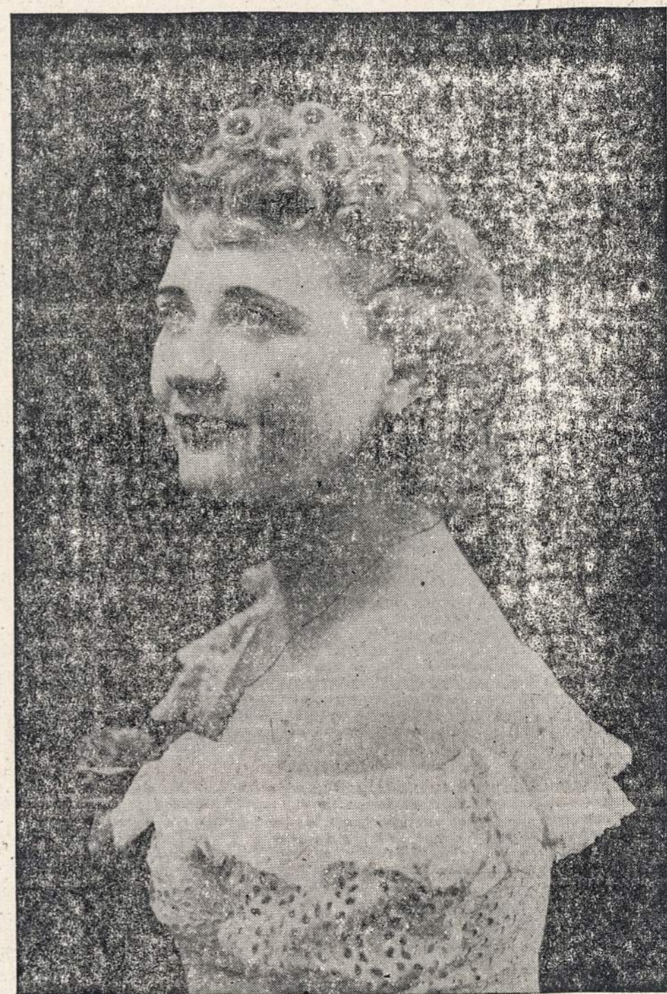
ONUKS SKEVERIUTE - STEPHENS Saffi vaidmeny

PIRMYN Choras stato Johann Strauss ČIGONŲ BARONĄ