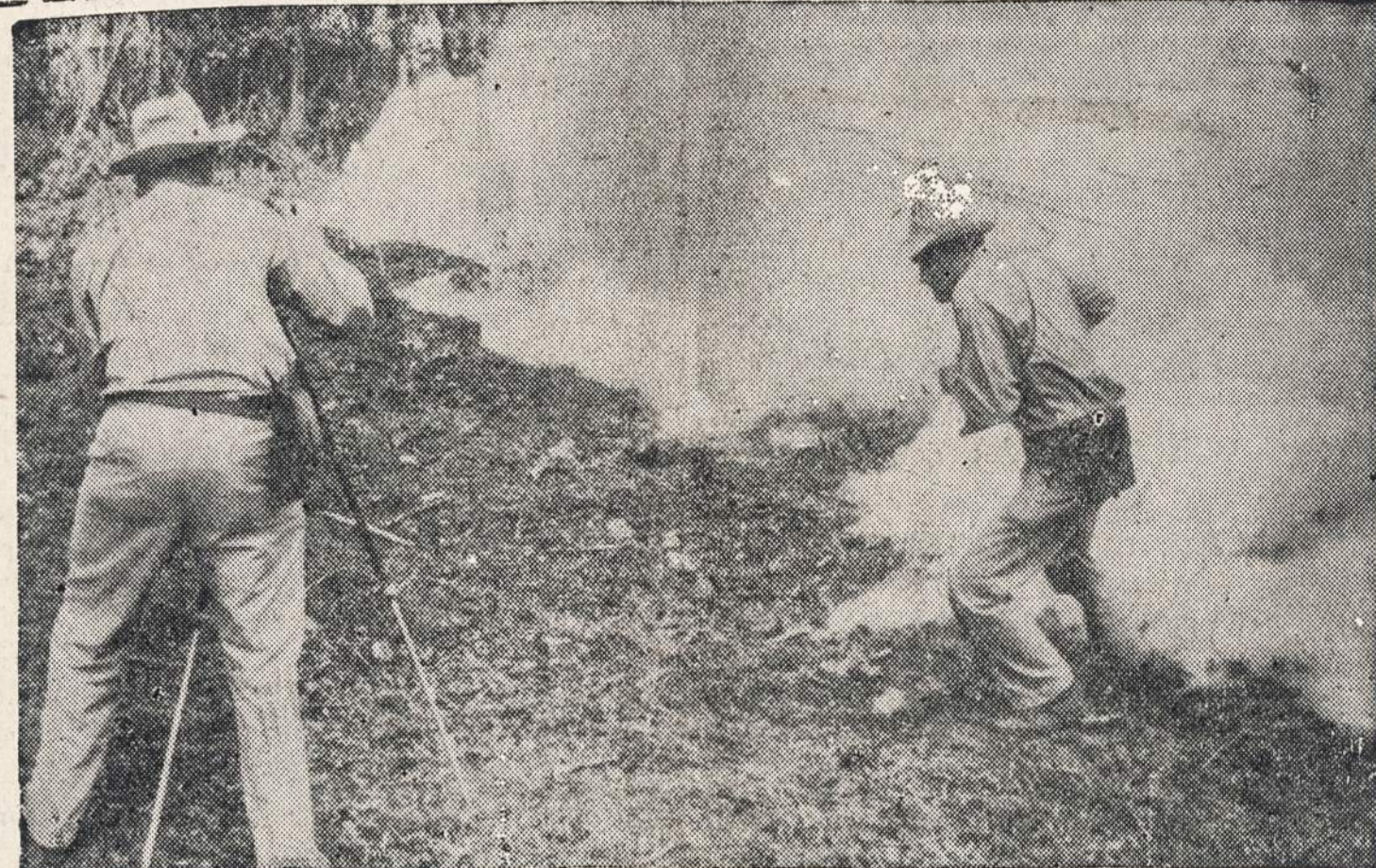
Kai prie Pahoa (Havaioose) vėl ėmė veikti ugniakalnis, tai mokslininkai skubinosi pasigriebti instrumentus ir pasižalinti į saugesnę vietą.

— 12,00* žmonių liko be pastogės, išsiliejęs Mississippi upei.