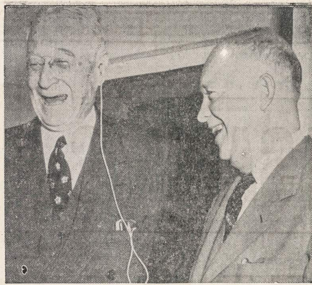
Bernard M. Baruch (kairėje) aplankė prezidentą Eisenhowerį. Baruch yra laikomas prezidentų patarėju.

PIRKITE JAV TAUPYMO BONUS. 4 — NAUJIENOS, CHICAGO 8, ILL. — MONDAY, MARCH 28, 1955