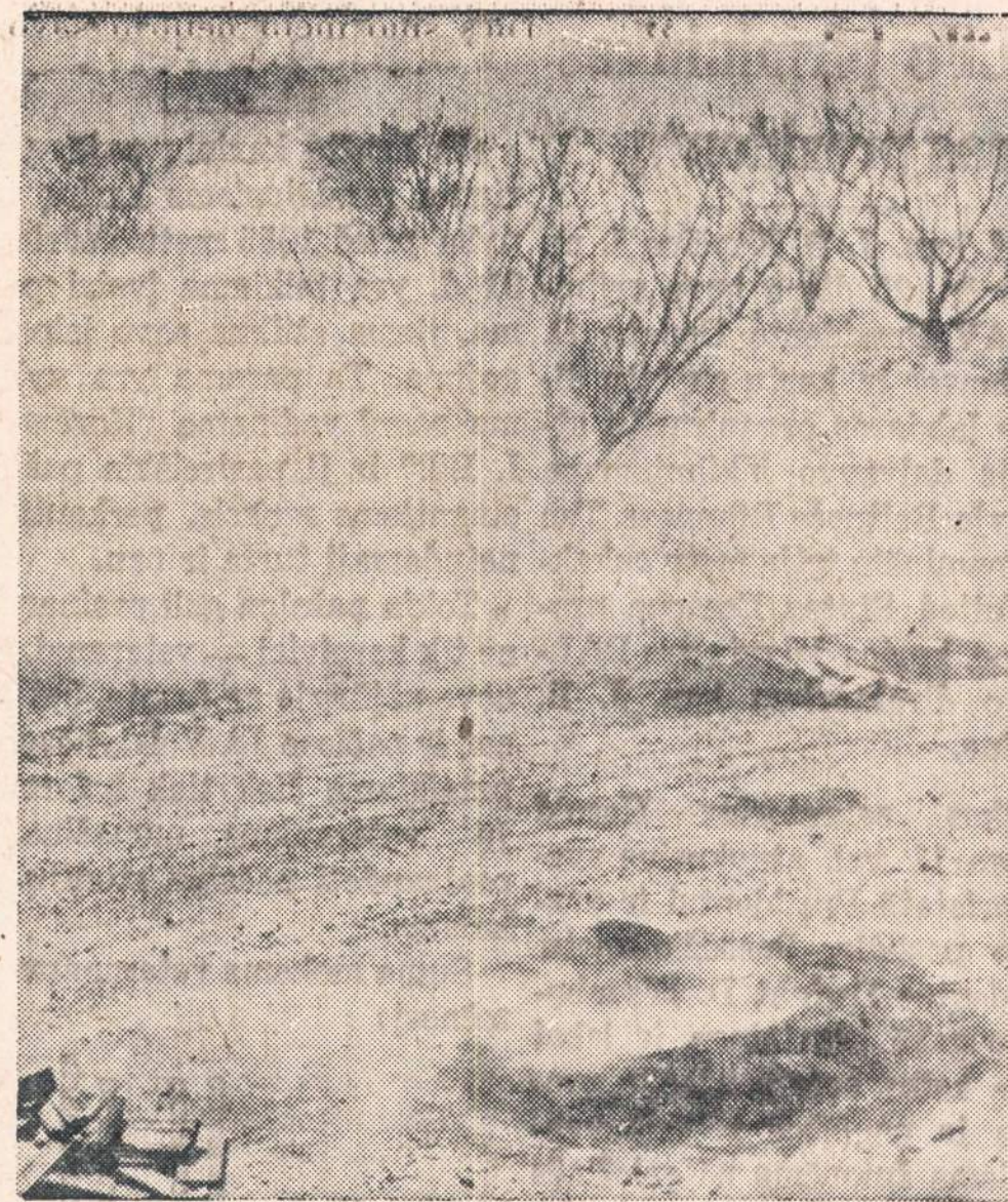
Shelby apskrityje, Tennessee valstybėje, buvo deginamos medžio pienuogos, senos padangos ir kitokios atmatos, kad sudarytu kaip galima daugiau dūmų, kuriu pagalba buvo siekiamasi išgelbėti persikų (pyčių) vaisių užuomazgas nuo nušalimo. Kaip žinia, netikėti šalčiai palietė visą eilę valstybių ir padarė daug nuostolių persikų ir kitų vaisių augintojams. Apskaiciuojama, kad nuostoliai sieks 50 milijonų dolerių.

4. Kad ir iš esmės nesutikdamas dėl leismosios enciklopedijos pobūdžio bei savotiško vyr. redaktoriaus elgesio, aš vis dėlto nepaneigiau enciklopedijos kaip informacinio šaltinio reikalingu-