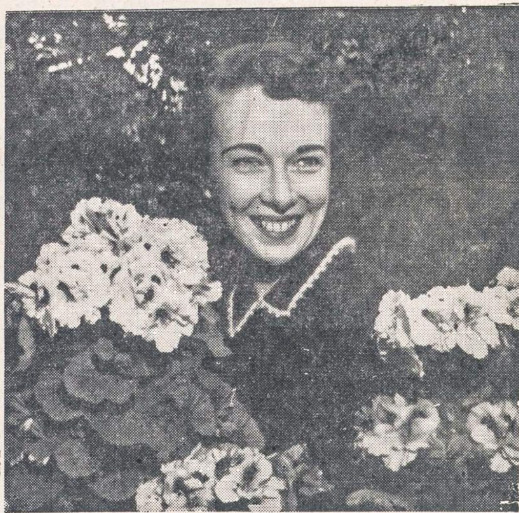
Lady Washington Geranium, Chicagos parkų distrikto tik gegužės mėnesį žydys augalas.

6 — NAUJIENOS, CHICAGO 8, ILL. —WEDNESDAY, JUNE 1, 1955