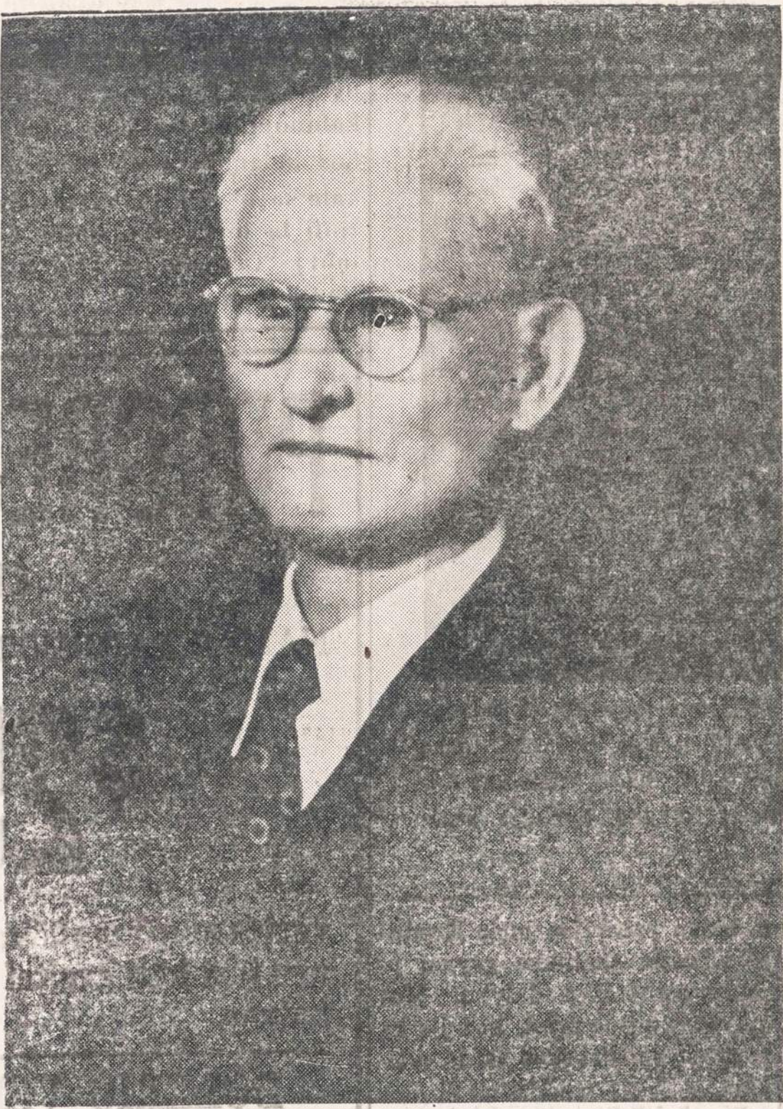
DR. KAZYS GRINIUS, Lietuvos Respublikos prezidentas — gimė 1866 m. gruodžio 17 d., mirė 1950 m. birželio 4 d.

Lietuvos išlaisvinimo reikalui teigiamus pareiškimus yra pakartotinai darę JAV kongreso nariai ir aukščiau-