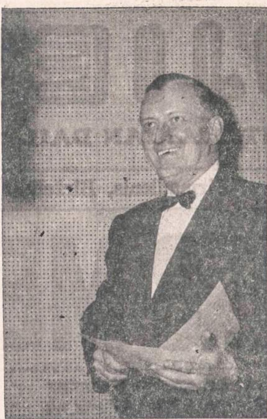
Pirmadienio vakaras "Šaltimiero Radoje" transliuoja Stasio Kernagio muziką ir dainą lygiai 8 v. v., iš galingos 5,000-watt WGES, 1390-kc. Klausykite!

Rusifikacijos darbą bolševikai stengiasi varyti labiausiai per jaunimą. Dėl to tėvų ir grynų lietuvių mokytojų pareiga atkreipti į tai rimtą dėmesį ir rūpintis neutralizuoti šias rusifikacijos ir bolševikinimo tendencijas. Jau nekalbant apie bolševikinimą, rusifikacijos tendencijas rasite kiekviename jaunimui skiriamame laikraštyje, kiekviename bolševikiškoje knygoje.