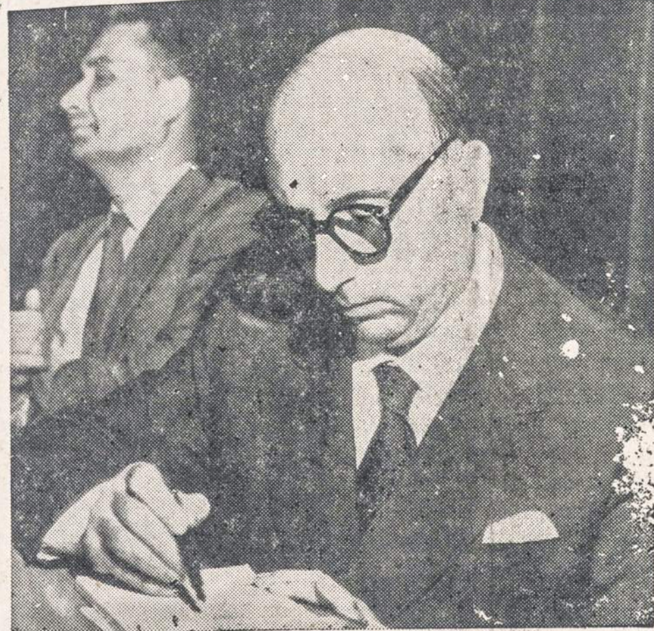
Italijos premjeras Mario Scelba dalyvauja Krikščionių demokratų partijos parlamento atstovų susirinkime. Susirinkimas turėjo pasisakyti dėl keturių partijų sudarytos valdžios koalicijos palaikymo. Atstovai pasisakė už tokios koalicijos rėmimą. Neofašistai ir monarchistai yra įteikę parlamentui pasiūlymą išreikšti koalicinei valdžiai nepasitikėjimą.

—JAV apeliaciniai rūmai pavirtino fed. teisėjo Youngdahl sprendimą prof. Lattimorės klaidingos priesaikos byloje. 5 balsais prieš 4 buvo atmesti 2 atvejai klaidingos priesaikos, bet palikti 5 kiti.