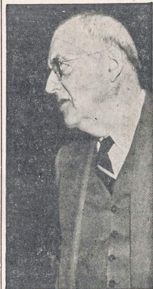
JOHN FOSTER DULLES Valstybės sekretorius

WASHINGTONAS, D. C. — Valstybės sekretorius John Foster Dulles pasiuntė per Naujienas ir kitus laikraščius telegramas Amerikos lietuviams, minintiems tragiškuosius birželio įvykius 1940—1941 metais.