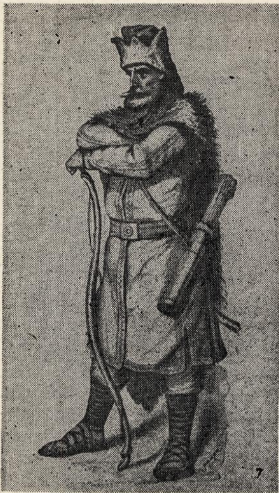
14 — 15 amžiaus lietuvis

Senesniais laikais nepatenkinti visuomenės santvarka žmonės lengviau galėjo iš jos išsiskirti, bet šiais laikais, taip milžiniškai padidėjus žmonių skaičiui, tai pasidarė nebeįmanoma. Žmonių gyvenimas pasidarė tiek sudėtingas, kad žmogus pats negali patenkinti savo kasdieninių, būtinų, gyvenimiškų reikalų. Jis yra tampriai surištas su visuomene. Kiekvienas juk yra reikalingas daktaro ar advokato, kiekvienam tenka ieškoti pagalbos ar pataravimo įvairių specialistų, turėti reikalų įvairiose įstaigose ir organizacijose. Panašus ryšis žmogaus su visuomene yra ir dvasiinio gyvenimo srityje. Priklausymas bažnyčioms ir moralės bei etikos reikalavimai verčia kiekvieną matyti kituose tokį pat, kaip jis, žmogų. Kultūriniuose reikaluose žmonės pilnai priklauso nuo visuomenės su jos kultūrinėmis institucijomis, spau-