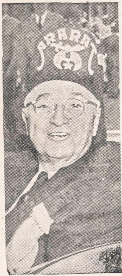
Buvo JAV prezidentas Harry S. Trumanas maršuoja šraimerių parade Chicagoje. Paradas įvyko liepos 12 dieną.