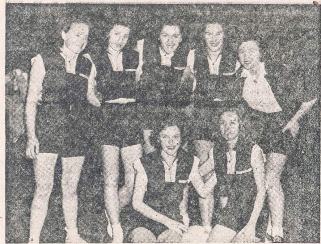
Lietuvių Sporto Klubo PERKŪNAS žaidėjos ateinantį sekmadienį dalyvaus tinklinio rungtynėse. Chicago ir jos apylinkių lietuviai galės pamatyti lietuvaites sportininkes, žaidžiančias Naujienu piknike