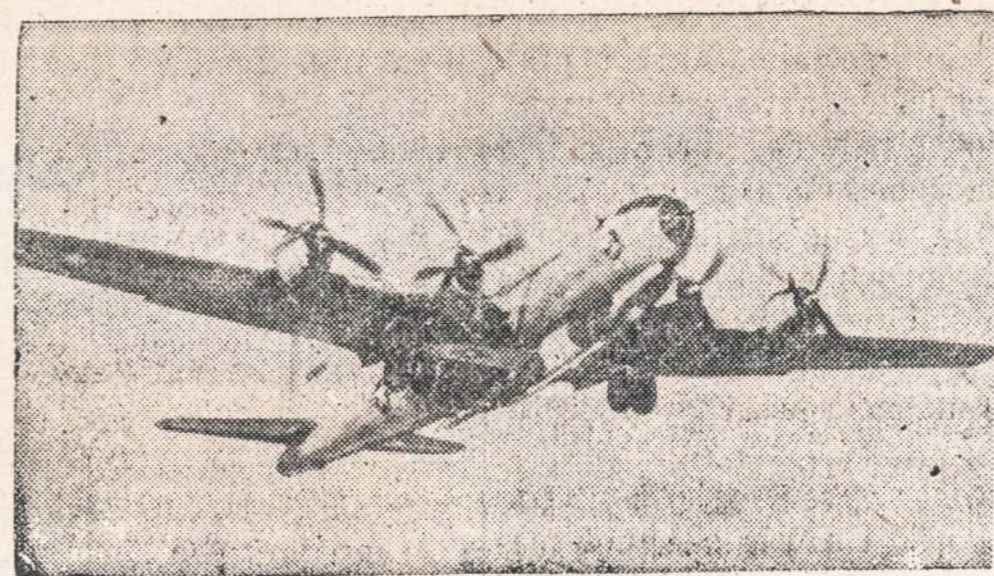
Nedidelis bandomasis raketinis lėktuvas Bell X-1-A, padaręs greitumo ir pasiekto aukštumo rekordą, turėjo būti nuo bombonešio atpalaiduotas, kai įvyko eksplozija. Bombonešio igula ir raketiniame lėktuve buvęs lakūnas išsigelbėjo. Bandymai buvo daromi Edwards oro bazėje, Kalifornijoje.