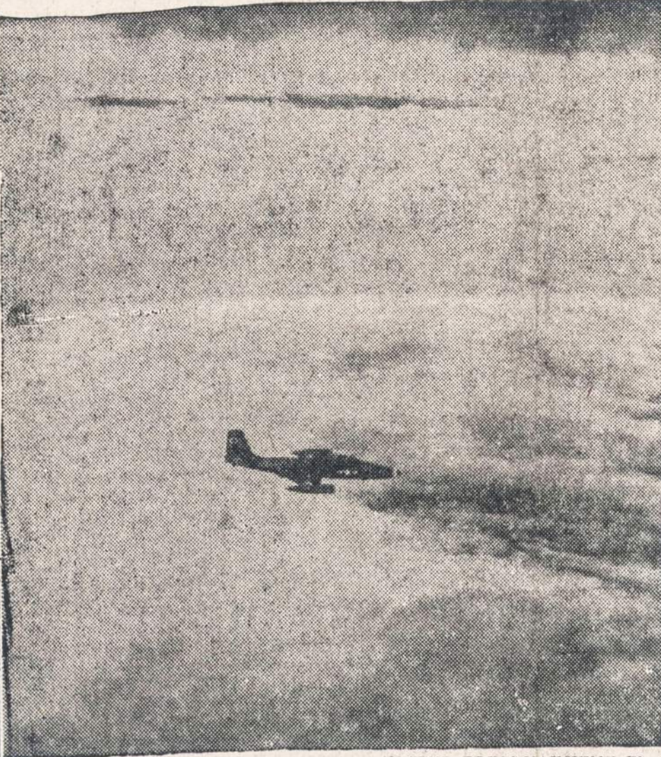
Laivyno sprausminis lėktuvas 20,000 pėdų aukštumoje skrenda "Connie" uragano link.

24 keleiviai ir autobuso šoferis žuvo vietoj. Kiti 7 žmonės, sunkiai sužeisti, nugabenti į artimiausią ligoninę. Iš jų 2 yra taip sunkiai sužeisti, kad maža vilties, jog jie pasveiks.