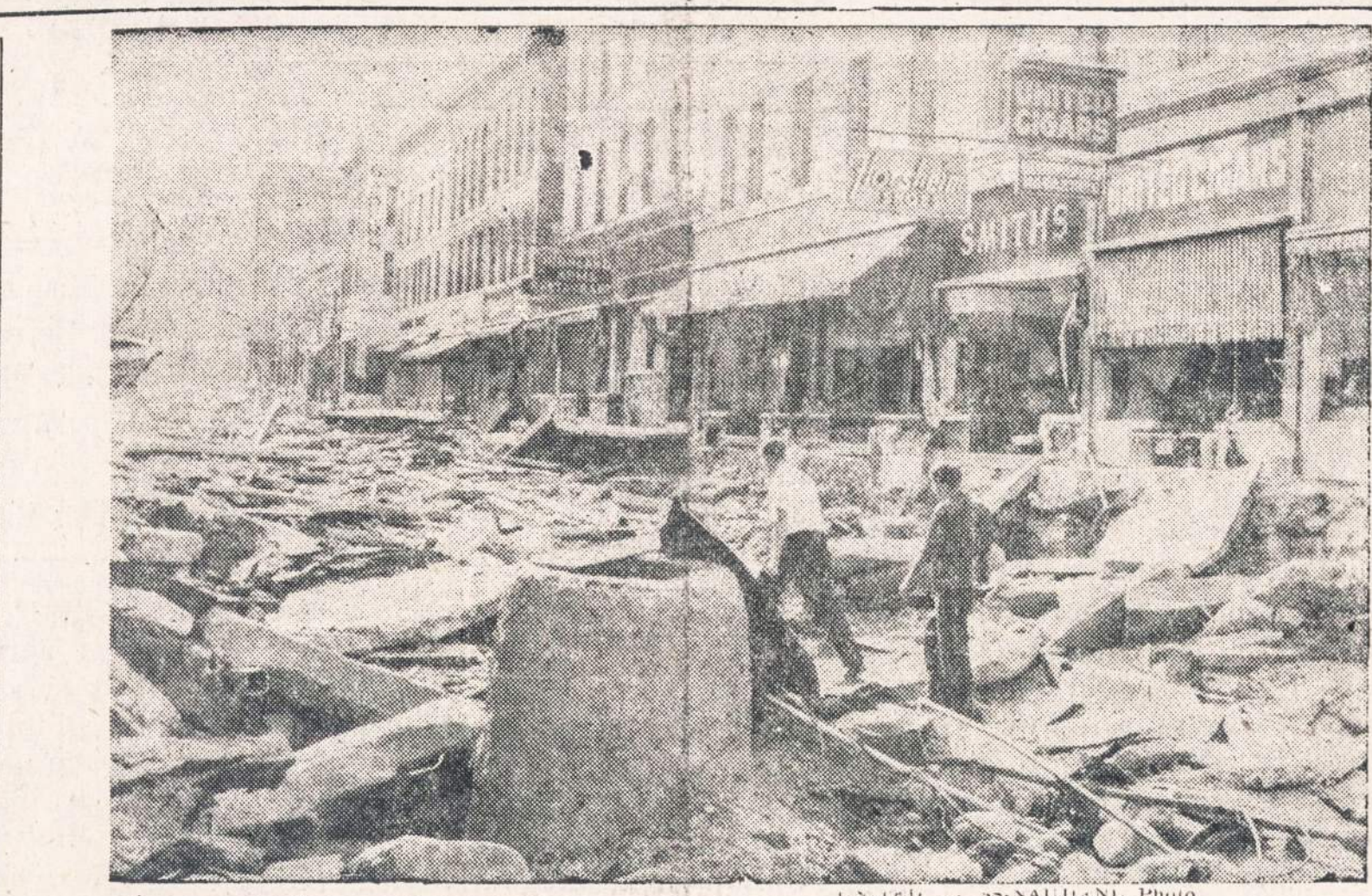
Pagrindinė gatvė Winsted, Connecticut, buvo visiškai sugadinta potvynio.

Kareivis susilaukė pagalbos iš vietos veteranų ir advokatų ir įtikino vyriausybę, kad jo nega-lima laikyti atsakingu už tėvo darbus arba pažiūras.