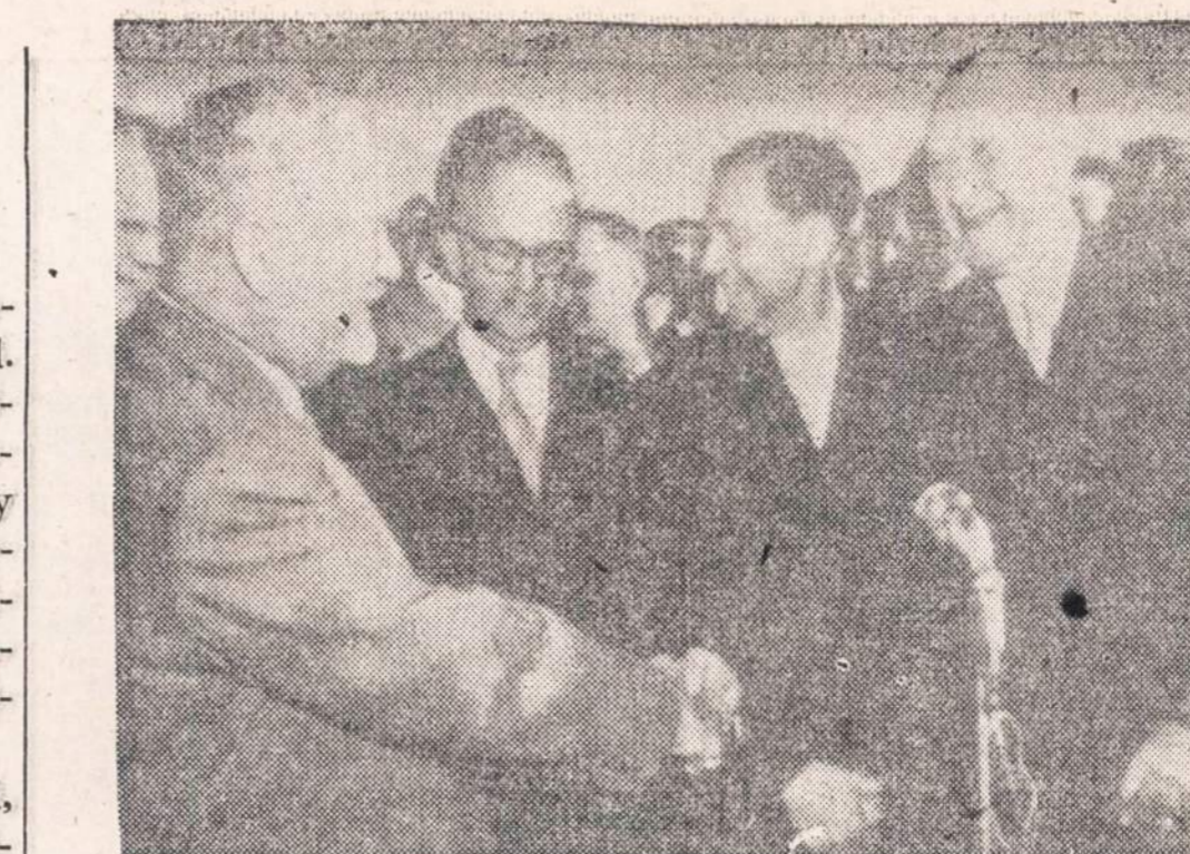
Sovietų premjeras Bulganinas, kairėje, priima vokiečių kanclerį Konradą Adenauerį. Vieni iš svarbiausių pasitarimų vokiečių klausimų buvo Vokietijos suvienijimas ir 200,000 vokiečių karo be-laisvių paleidimas.

Vieno šito fakto akivaizdoje sunku suprasti, kaip gali užsimegzti tarp Sovietų Sąjungos ir vakarinės Vokiet-i-jos "normalūs santykiai".