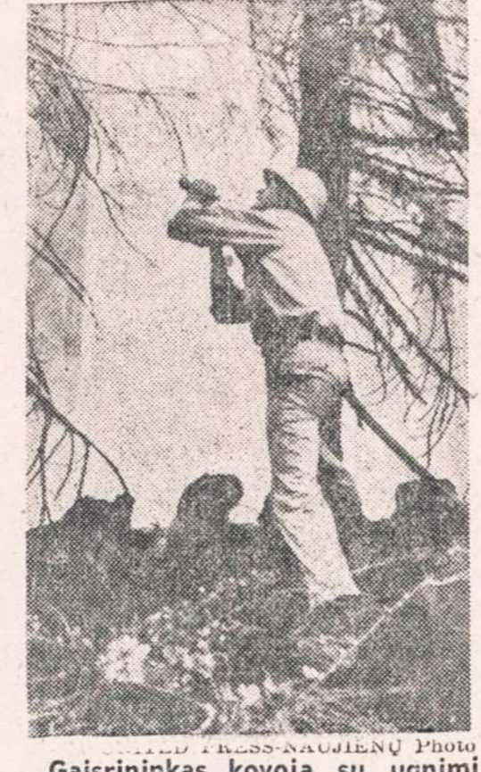
Gaisrininkas kovoja su ugnimi gaisro įvykusio Gen. Grant Grove, California, metu. Po 6 dienų gaisrą pavyko užgesinti. Išdegė 17,000 akrų. Nuostolių pararyta už 3 mil.

Tie Chicago advokatai vien užmiestinių bylų nuo 1954 m. sausio 1 d. iki šių metų balandžio 1 d. yra gynę 961 apimančią 27 valstybes; jų ieškinio suma siekia $13,694,100. Kadangi advokatams bei jų firmoms tenka tokiose bylose maždaug 25%, tai jie bus išikišę į kišenę daugiau kaip 3 milijonus dolerių.