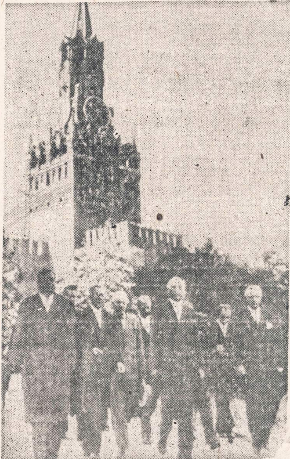
Vakarų Vokietijos kancleris Konrad Adenauer, viduryje dešinėje, su savo svita išėina iš Kremliaus Maskvoje. Pranešama, kad Sovietų-vokiečių konferencija pasiekė mirties tašką, bebando nustatyti ateities santykius tarp šių buvusių priešų valstybių. Adenaueris, norėdamas pataisyti nesisekančius derybas, pakvietė sovietų premjerą Nikolai Bulganiną akis į akį 2 asmenų pasikalbėjimui.

— 50 žmonių nuskendo prie Naangoa, Prancūzų Vakarų Afrikoje, apvirtus keltui.