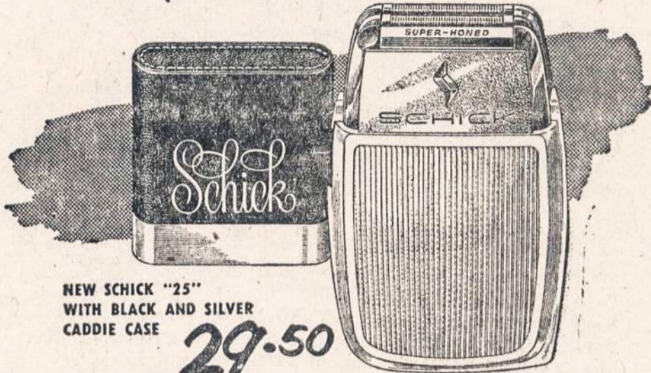
NEW SCHICK "25" WITH BLACK AND SILVER CADDIE CASE 29.50

shaves so close it leaves nothing on your face but a smile!