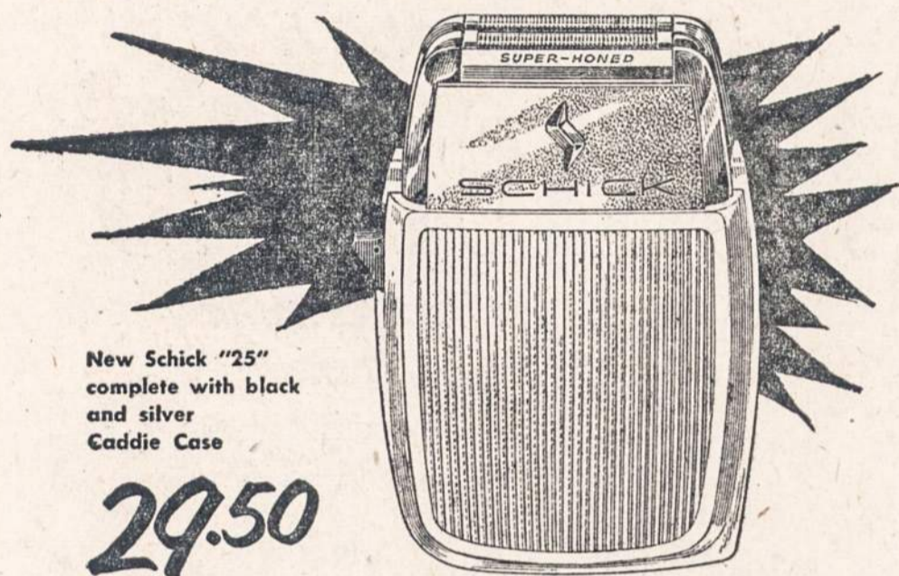
New Schick "25" complete with black and silver Caddie Case 29.50

makes anything you shave with now as outdated as a straight razor!