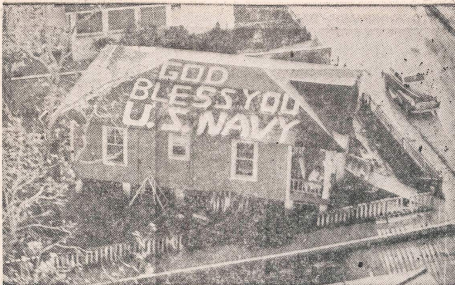
Išreikdami savo dėkingumą JAV laivynui, Tampico miesto Meksikoje gyventojai ant stogo rašo padėkos šūki. Laivais ir helikopteriais laivynas išgelbėjo tūkstančius žmonių, taipgi pristatinėjo maistą ir vaistus daugiau negu savaitę laiko "Janer" uragano nusiaubty apylinkių gyventojams. Priskaitoma 600 žuvusių ir apie 70,000 be pastogės.

V. Šimkus kėlė mintį surengti Vilniaus literatūros ir meno vakarą, pasikviečiant žmonių iš rytinių valstybių. Paskui imtis iniciatyvos, susidedant su kitomis draugijomis, ar kitu būdu, įsivendant savo radijo pusvalandį vieną arba dukart savaitėje. Šia proga jisai pakvietė visus draugijos narius sekantį susirinkimą daryti jo rezidencijoje. Reikėtų padaryti ir vaikų susirinki-