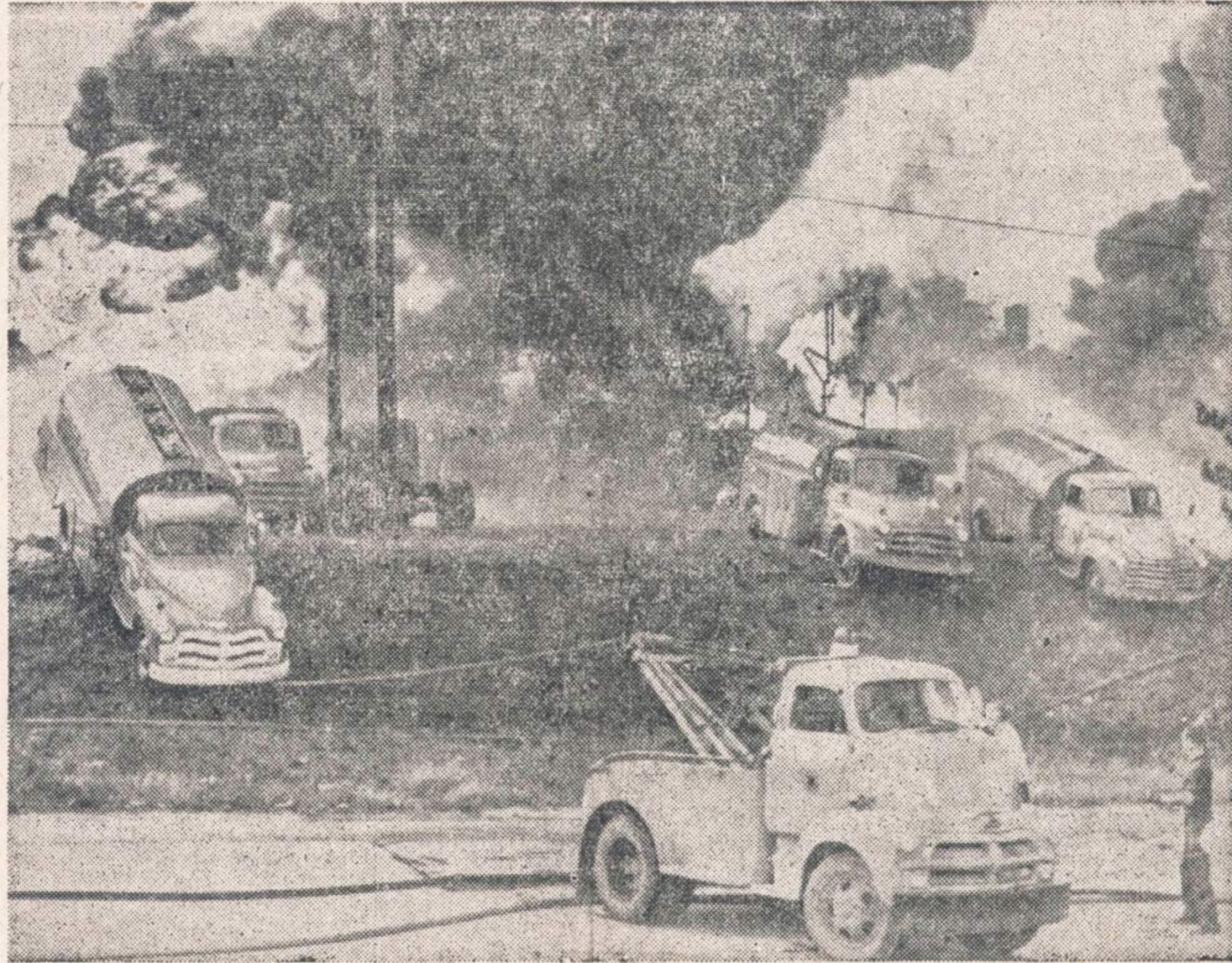
Flint, Mich., gaisras sunaikino 4 Blue Oil Co. gazolino tankus $250,000 vertės. Perarti gaisro vietas stovėję gazolino pakrauti sunkvežimiai išvelkami specialiais kranais, nes šoferiai, dėl didelio karščio, negalėjo prie jų prieiti.

Sovietai su vokiečių karo belaisviais paleido ir vokiečių žurnalistą Dieter Freede, kurį pagrobė 1947 metais ir buvo nuteisė 25 metus kalėti kaip "šnipą".