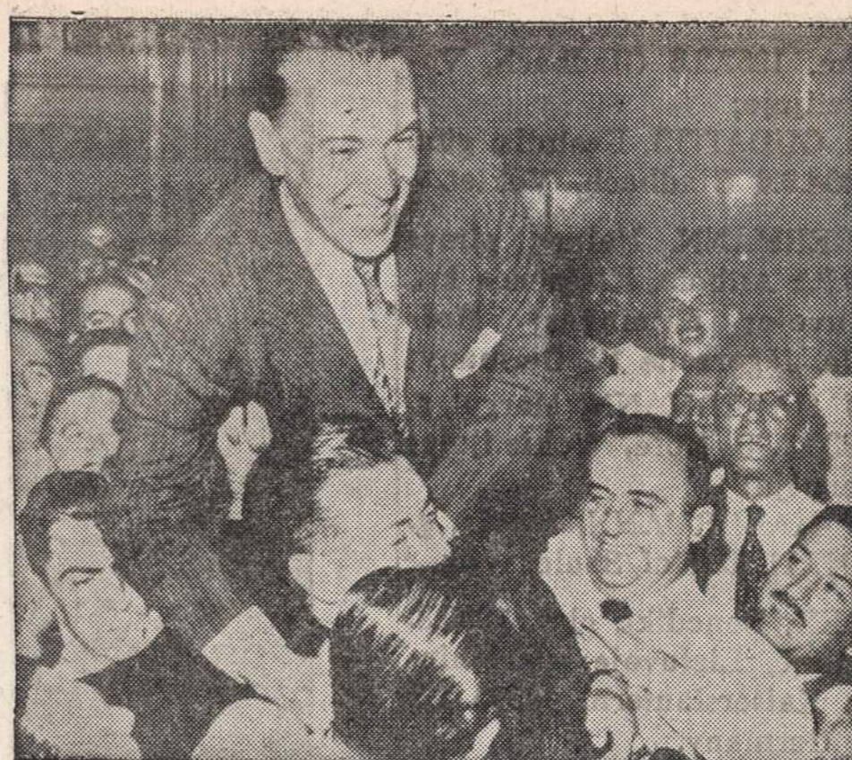
Besišypsantį Juscelino Kubitschek jo rėmėjai neša ant pečių vienos priešrinkiminės kampanijos metu Rio De Janeiro. Jis yra socialistų-darbių koalicijos, kurią palaiko ir komunistai, kandidatas į Brazilijos prezidentus. Kol kas jis žymiai praneša visus savo varžovus. Jeigu bus išrinktas, numato tuojau daryti keliones po JAV ir Europą.