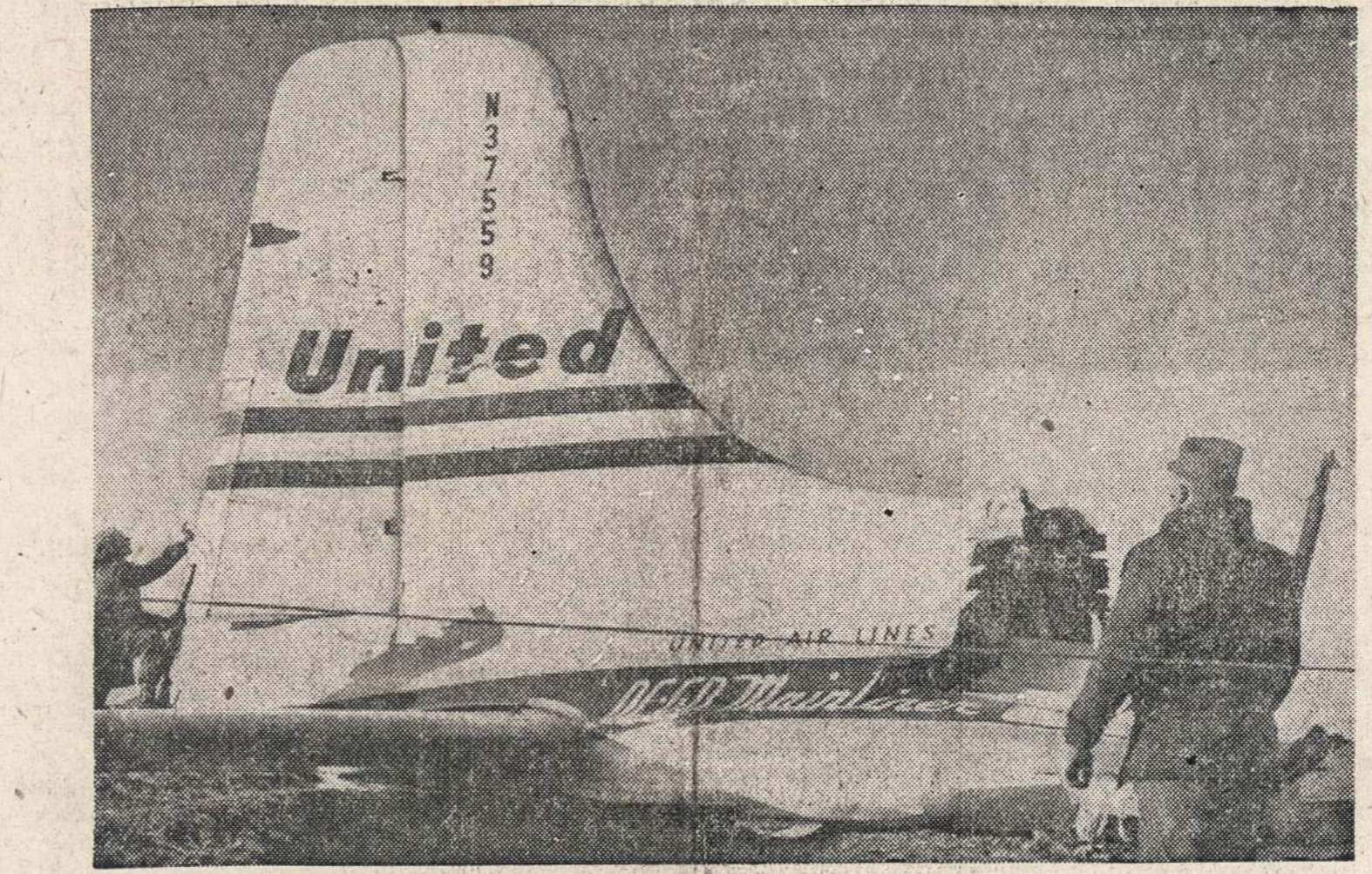
Tik uodega teliko iš United Airlines lėktuvo, kuriam sudužus ties Longmont, Colo. 44 keliausieji buvo užmušti. Specialistai mano, kad nelaimė įvyko dėl sprogimo lėktuvo viduje.

Lietuvių valanda parodoje bus lapkričio 13 d. nuo 8 ligi 9 val. vakare.