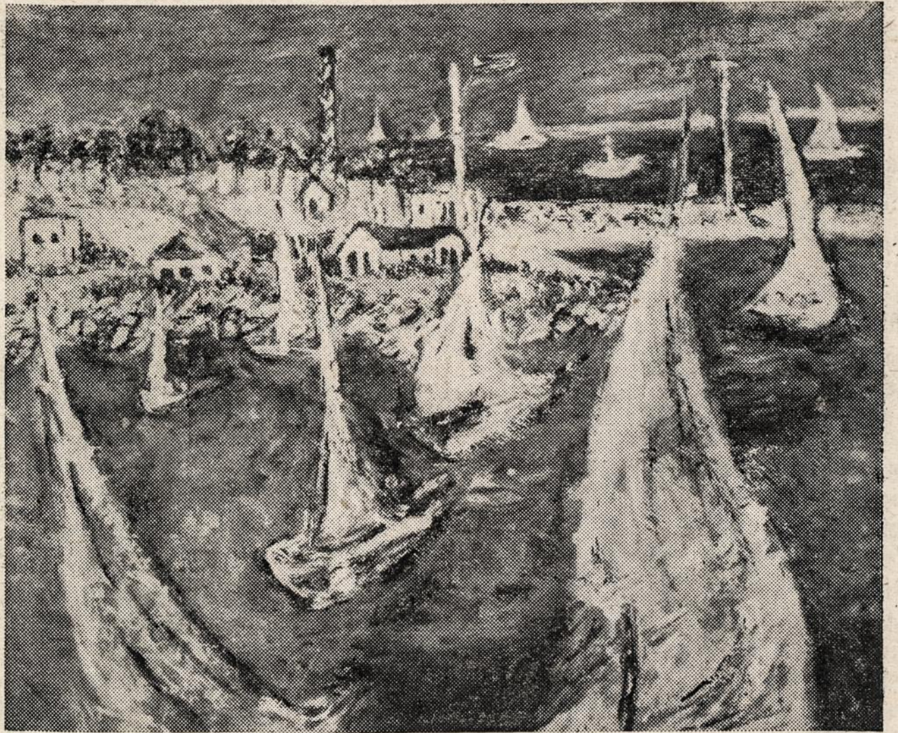
LAIVELIŲ UOSTAS MICHIGAN EŽERE (aliejus) J. DOBKEVIČIŪTĖ - PAUKŠTIENĖ

Tokia melodramatiška buvo didžiojo rašytojo karjeros pradžia. Vienok tik kelis