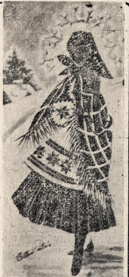
MISS ELLEN PUTRIS atviruko pavyzdys.