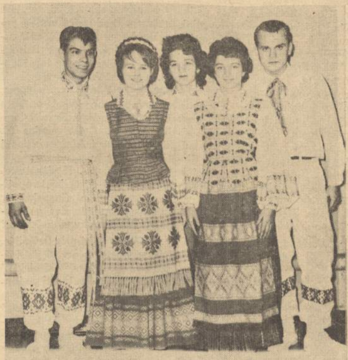
"Ateities" tautinių šokių šokėjų grupė