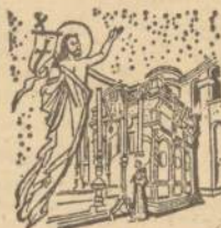
The Holy Sepulchre

The sons of St. Francis need Priests and Brothers for work at the Sacred Shrines and in the Lands of the Bible.