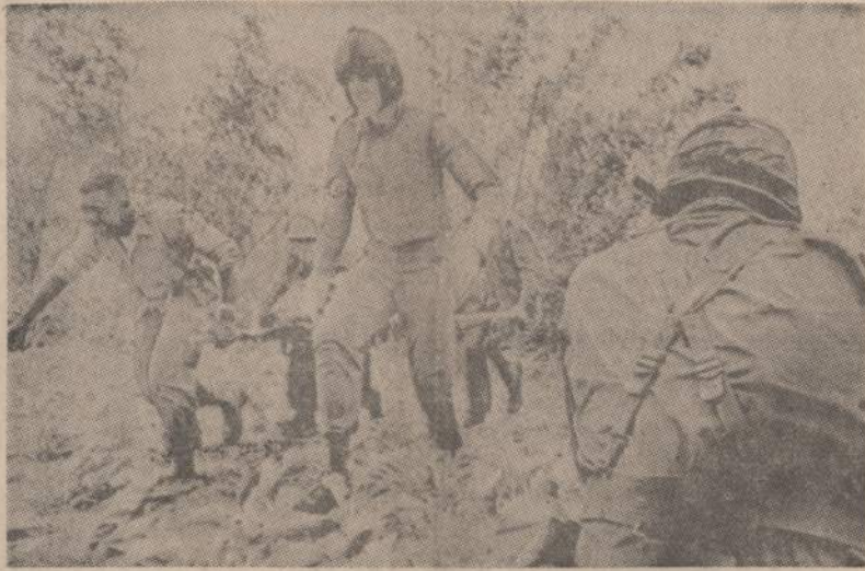
Keturi Amerikos sanitarai neša į pirmos pagalbos stotį pirmose fronto linijose sužeistą mariną. Kitas karys juos apsaugo, kad priešas nesužeistų sanitarų.

MANILA. — Filipinų prezidentas Ferdinand Marcos pareiškė, kad komunizmas nuolat gresia filipinams ir jis duos visą galimą paramą Pietų Vietnamui, kovojančiam prieš komunizmą.