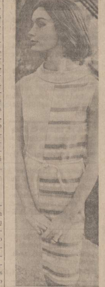
Margy spalvų megininkas mestas rinkon. Italai mano, kad moterys gali pamėgti pusiau baltą ir pusiau margą megininę suknelę.