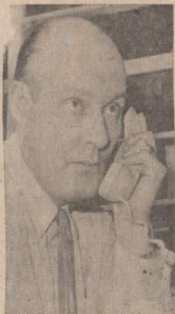
Ligšiolinis general. prokuroras Nicholas Katzenbach (kairėje), prezidento paskirtas valstybės departamento pasekretoriumi vietoje George W. Ball.

WASHINGTONAS. — Prezidentas Johnsonas paskyrė CIA žvalgybos biuro direktoriaus pavaduotoju admiralą Rufus Taylor. CIA vadovauja civilis Richard Helms. Įstatymai reikalauja, kad vienas iš dviejų vyriausių direktorių būtų kariškis.