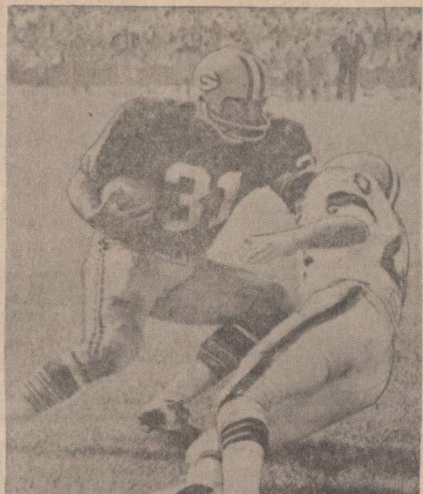
Pagarsėjęs Green Bay žaidėjas Jim Taylor permeta Clevelando Ross Fichtnerį ir laimi 21—20.