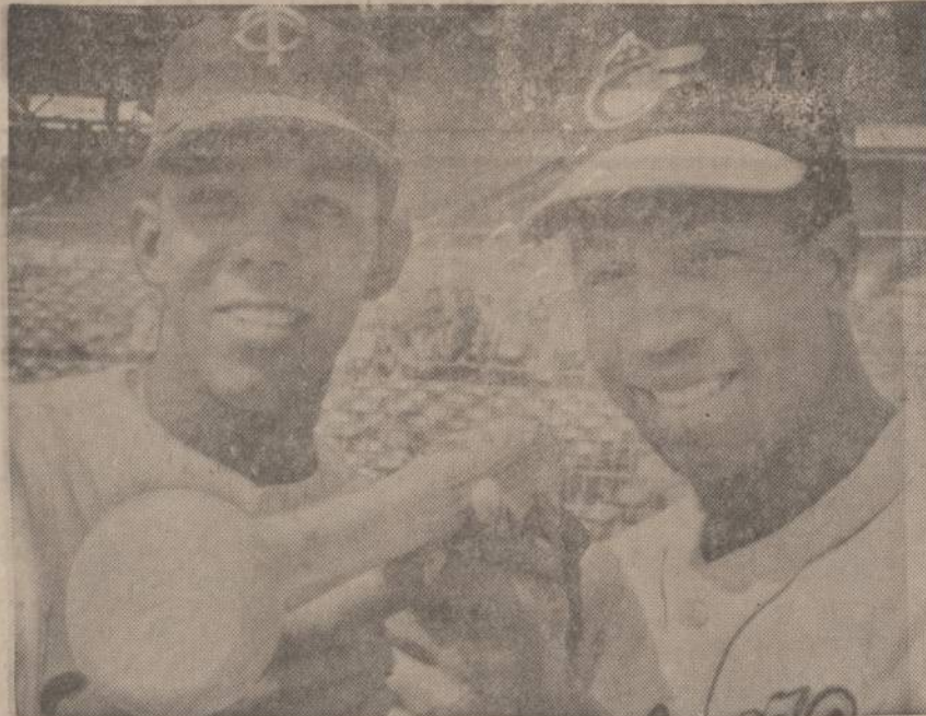
Sportininkai Tony Oliva ir Frank Robinson yra labai geri sportininkai, bet žiedu rungtis paties geriausio beisbolininko titului gauti.

Pagaliau visuomenė buvo staigiai nudžiūginta spaudos pranešimu iš 4. 16. 66, kad ginčui spresti sudaryta arbitražo Komisija ir kad abi ginčo pusės priėmė ir pasirašė tos Komisijos paruoštą 6-šių punktų nutarimą. Sušauktame posėdyje buvo sudarytas Čiurlionio Galerijai valdyti ir tvarkyti Globos Komitetas. To