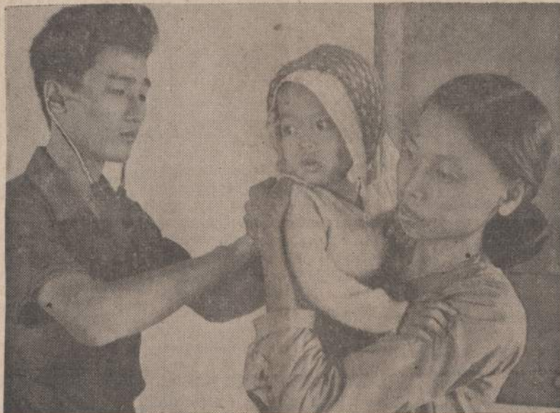
Vietname gydytojai tikrina sveikatą susirgusių vaikų. Nežiūrint karo ir pavojaus, Vietnamo valdžia įvedė programą sveikatai tikrinti ir pagalbai teikti. Amerikiečiai padeda šią programą pravesiti.

BONA. — Vakarų Vokietija pažadėjo paskolinti Indonezijai 12,5 milijonų dolerių.