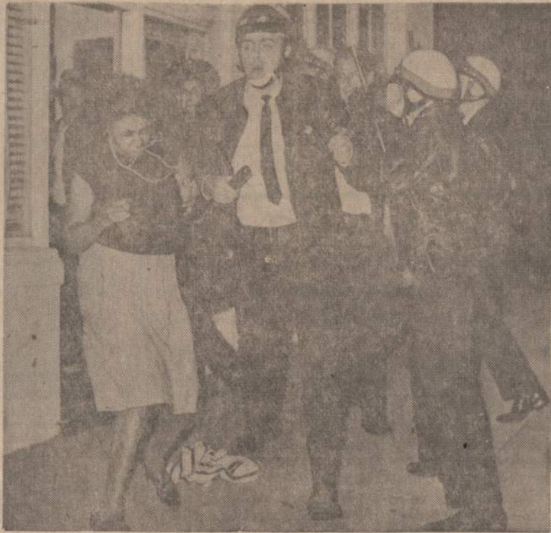
San Francisco mieste du negruikai pavogė automobilį, buvo pastebėti, bet bėgo nuo policijos. Policija vieną nušovė. Miesto negrai rengėsi protestuoti. Policija suėmė kelis agitatorius.