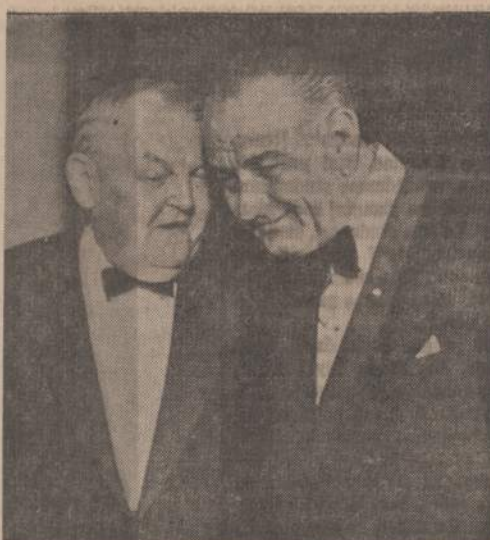
Vokietijos kancleris Erhard atvyko į Washingtoną tartis su prezidentu Johnsonu dviejų valstybių reikalais. Abiejų valstybių vadai nutarė ir toliau glaudžiai bendradarbiauti.