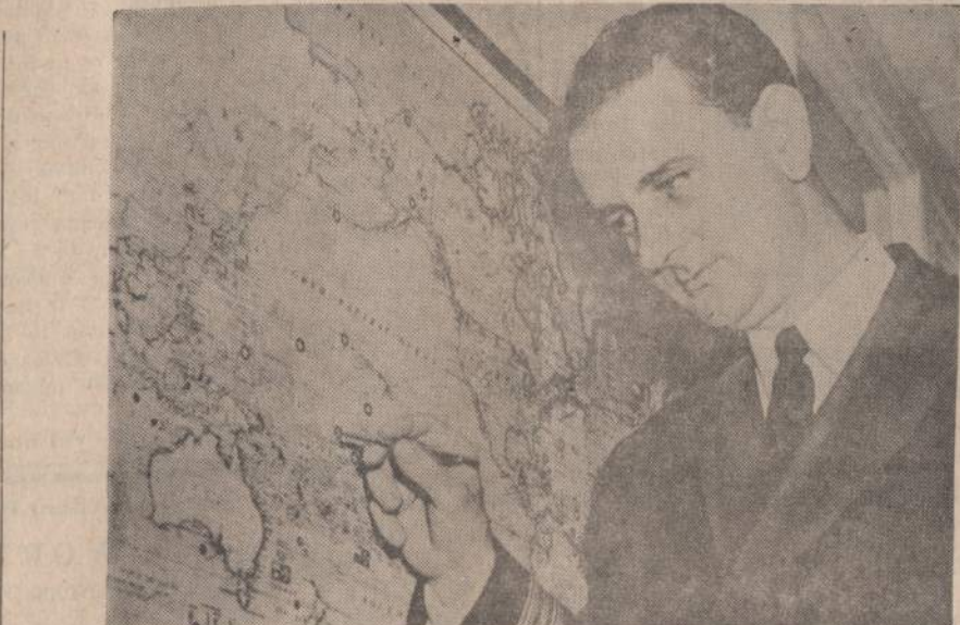
Antrojo Pasaulinio karo metu prezidentas Johnsonas buvo karo lakūnas. Jam teko dalyvauti kovoje prieš japonus. Leitenantas komandierius Johnsonas bombardavo japonus įvairiose Pacifiko salose. Manoma, kad šiomis dienomis jis aplankys tas Pacifiko salas, kuriose jam teko dalyvauti karo veiksmuose.

Europą, kur jis nušvies Manilos konferencijos eigą Vakarų Europos vyriausybėms.