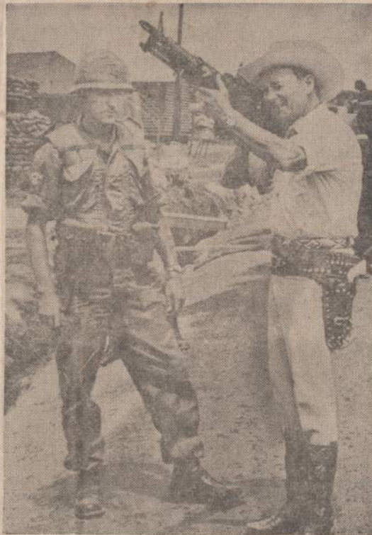
Roy Rogers, nūvykęs į Vietnamą, rodo karius, kad jis moka šaudyti ir moderniais ginklais.

► Paryžiuje vakar susitiko prezidentas de Gaulle ir Etiopijos imperatorius Haile Selassie.