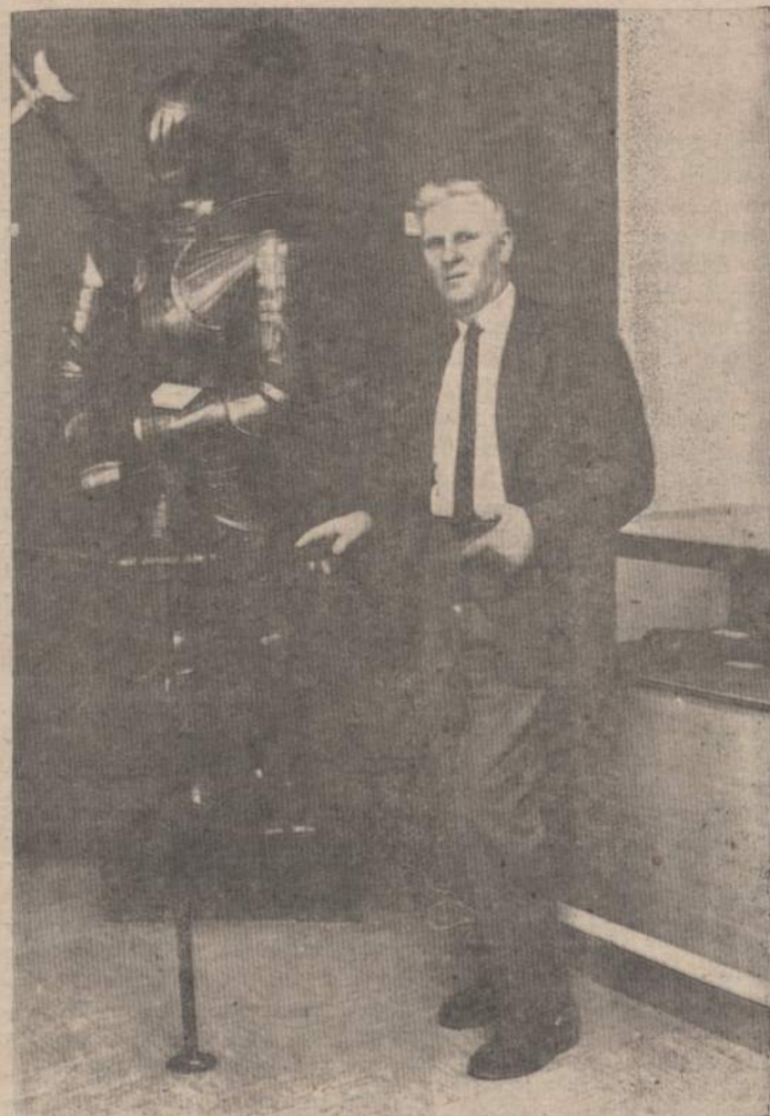
ST. BALZEKO, Jr. MUZIEJUJE

Neišvengiant mažyčio nuklydimo į pakeles, tenka manyti, kad ir visi mūsų lietuviškieji Anuprai ir Baltrai čia Amerikoje tik todėl paliko senberniai, kad susitikdami su išteketi pasirengusiomis Agotomis ir Brigitomis visada varžydavosi, drebdavo ir, žado netekę, niekaip negalėdavo joms pasakyti, kad jie nori vesti. O vien tik norų juk dar nepakanka; reikia ir veiksmų. Tereikėjo mandagiai išstentėti tą, beveik ritualiniu tapusį, magiškąjį sakinį: “Mielai Agočiute arba Brigičiute, ar sutinki būti mano šonkauliu, mano žmonele? Eh?” Ir būtų visas reikalas pasibaigęs palaimintu, amžinai nebeatmezgamu mazgu kur nors bažnyčioje, o iš tenai