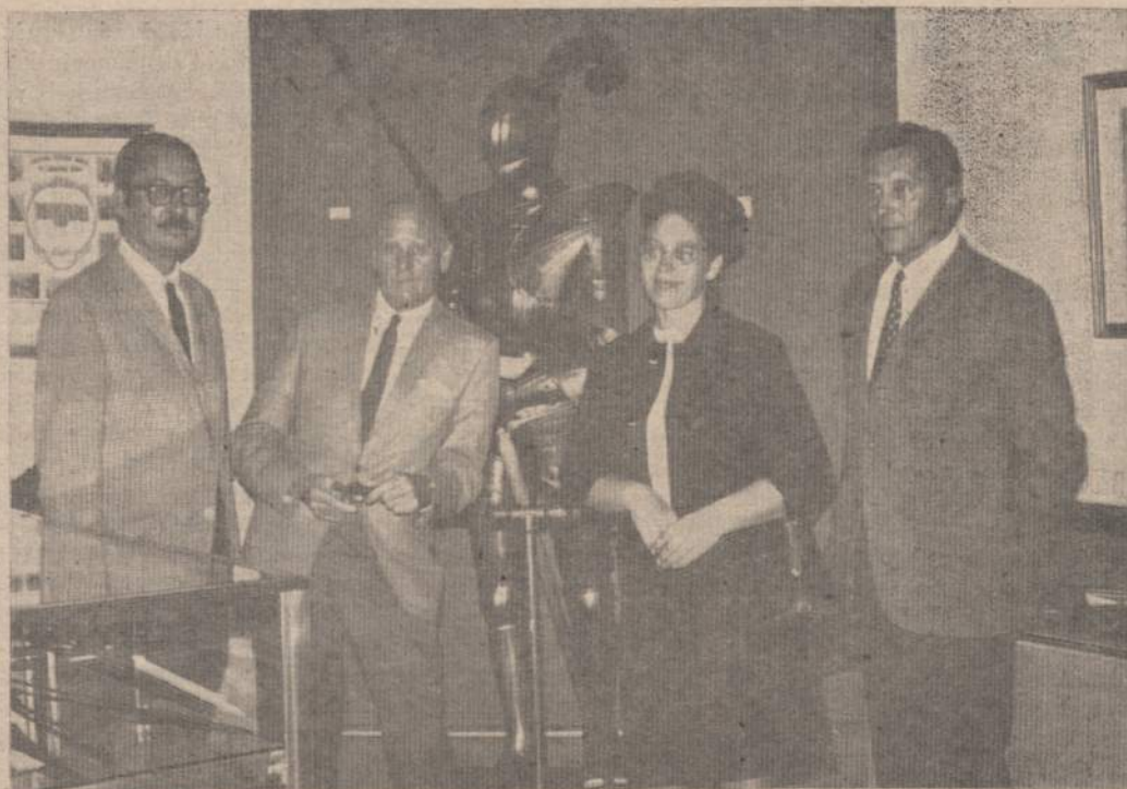
ST. BALZEKO, Jr. LIETUVIŲ KULTŪROS MUZIEJUJE

Į vyrus suaugęs tėvelių sūnelis, pajutęs pirmąjį vedybinį