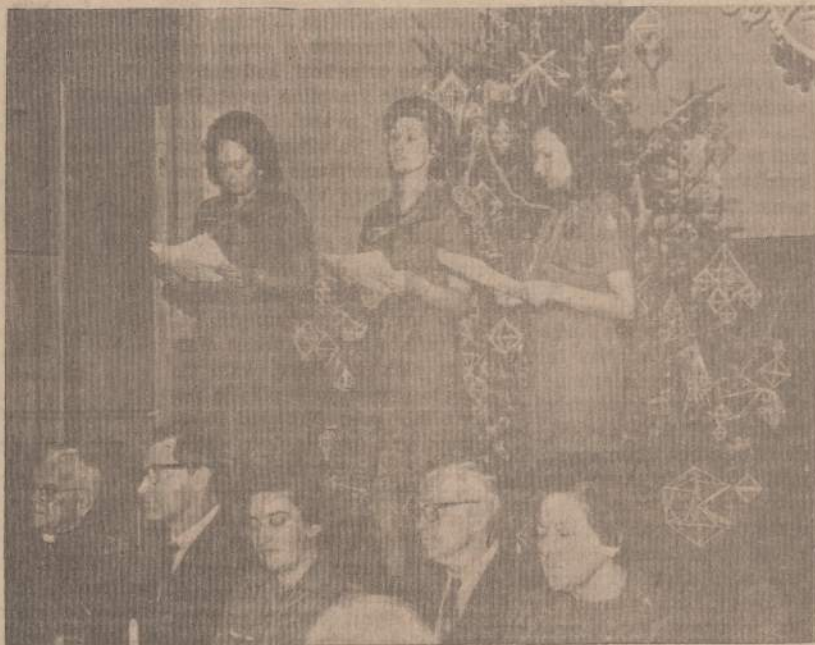
PHILADELPHIJOS VYRESNIOSIOS SKAUTES ATLIEKA PROGRAMĄ PRIE KALEDŲ EGLUTĖS PER BENDRĄ KŪČIAS

Marquette Parko Bendruomenės Valdyba nuosirdžiai prašo lietuviškąją visuomenę parodyti jai pastikėjimą ir ją pagal išgales remti.