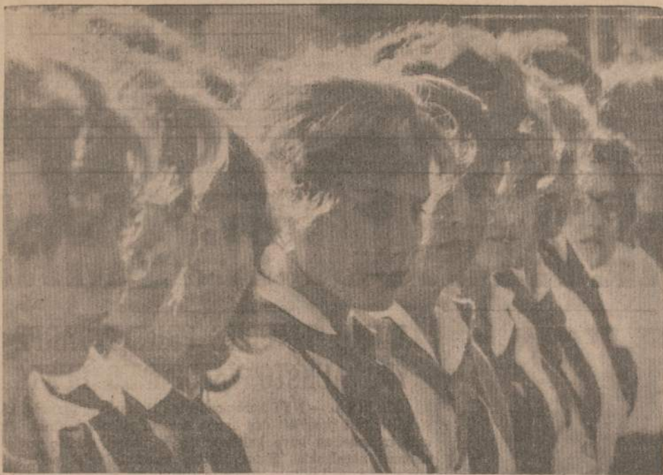
AKADEMIKES SKAUTES IŠSIRIKIAVUSIOS STOVYKLOJE PRIE VELIAVOS