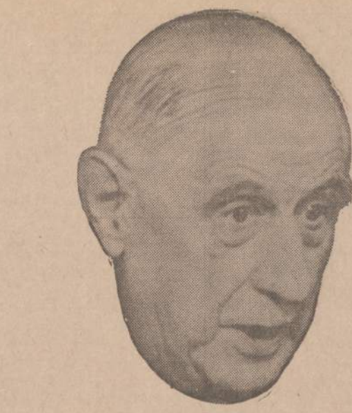
Prezidentas Charles de Gaulle rengiasi tartis su prezidentu Nixonu įvairiais Prancūzijos ir Vakarų Europos reikalais. Charles de Gaulle negalėjo susitarti su trim JAV prezidentais. Nixonas bus ketvirtasis, kuris bandys ieškoti bendros kalbos su savo valią primesti bandan-čiu Prancūzijos prezidentu.

REMKITE TUOS BIZNIERIUS, KURIE GARSINASI "NAUJIEŅOSE"