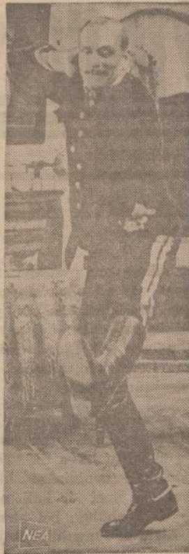
Kino artistas Laurence Olivier šoka naujai sukamame filme.