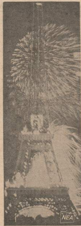
Paryžius vadinamas Šviesos Miestu. Kad gen. Charles de Gaulle valdoma Prancūzija tikrai žibėtų, valdžia apšvietė Eifelio bokštą. Vakaraš šis bokštas kartais susvinta paveiksle matomomis šviesomis.