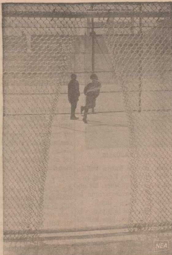
Šeštadieniais ir sekmadieniais visos New Yorko žaidimo aikštelės yra uždarinėtos, vaikai negali jomis naudotis. Į aikštelę vaikai gali įlysti tik per tvoros plyšį. Planuojama leisti vaikams naudotis aikštelėmis ir savaitgaliais.

Jei “Akiračiai” tokiu atsargumu parodė gyvenimą Lietuvoje,