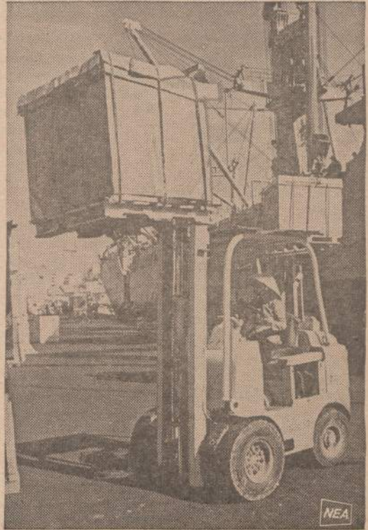
Vietname vyras išėjo į frontą, o moterys perėmė visus laivų iškravimo darbus. Paveiksle matome vietnamietę moteriškę, operuojančią keltuvą. Moterys jau iškravė maistą ir kitas medžiagas iš kelių Amerikos laivų.

Ekonomiškai prakutusios jaunosios kartos lietuvių išėvijoje yra tūkstančiai, bet menkas “Akiračių” prenumeratorių skaičius rodo, jog laikraščio leidėjams su jaunesniąja karta dar nepavyko surasti ben-