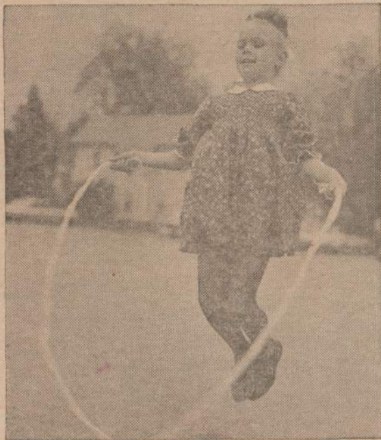
Pavasarij visi vaikai eina laukan ir žaidžia. Matome žaidžiančią mergaitę.