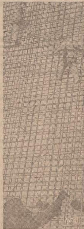
Sovietų valdžia jau naudoja atomo energiją elektrai gaminti. Rusai tvirtina, kad jie jau turi dvi stotis, kuriose degantis atomas gamina elektrą. Paveiksle sovietų darbininkai stoto naują stotį atomo energijai naudoti.