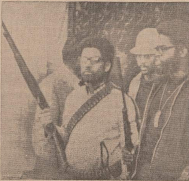
AMERIKOS UNIVERSITETŲ STUDENTAI 1969 METAIS

Įstaigos pietuose kiemas automobiliams pastatyti