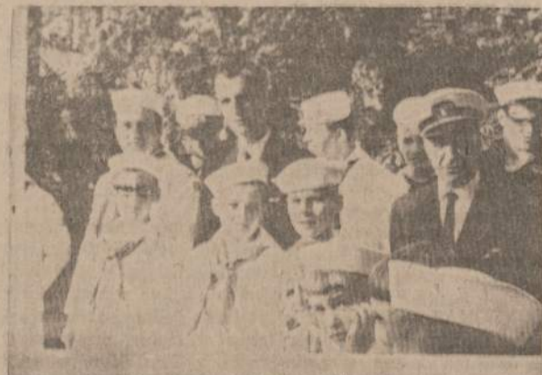
LJS Clevelando jūrų skautų junginio vadovai ir skautai žvelgia į vandenį, lie seka besimokančius būriuoti. Saulė kylo, pavasaris švinta ir jauno skauto dvasia nerimsta — vertė veržiasi į gamtą, prie vandens sporto. Ir jiems visiems Geru Vėjui!

rai nepavilios nuo skautybės idealo. Na, ir koks reikalas jaunai mergaitėi dėti tiek sielos, pinigų skirti ir laiką gaišti madų pasaulyje, kada jaunystė yra pati savyje grožis! Jauna mergaitė, tai ryto rasotos pievos tik prisiskleidęs žiedas... Ir ką tu tik ant jo nebedėsi — brangenybes ar dėšintukų krautuvės blizgučius — visu kuo jo grožį tik pridengsi, tik uždengsi... Jaunos mergaitės grožį visada daugiau išryškina kuklus drabužėlis, ir moralus jos elgėsys. Mergaitės fizinio ir dvasinio grožio harmonija amžias buvo ir paliks aukščiausias grožis ir jis tebūnie kiekvienos skautės idealas! Ryžto ir pastangų sesei — Geru vėjo! Z. J.