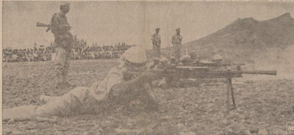
Pietų Jemenas, buvęs britų Adenas, gavęs nepriklausomybę, pradėjo stiprinti savo kariuomenę. Sovietai siūnčia daug ginklų. P. Jemeno prezidentas neseniai pareiškė, kad “greit dangus ir žemė bus pilni naujų ginklų, lėktuvų, tankų ir patrankų”. Tada Jemenas bandys nešti “revoliuciją ir kaimyninius kraštus.”