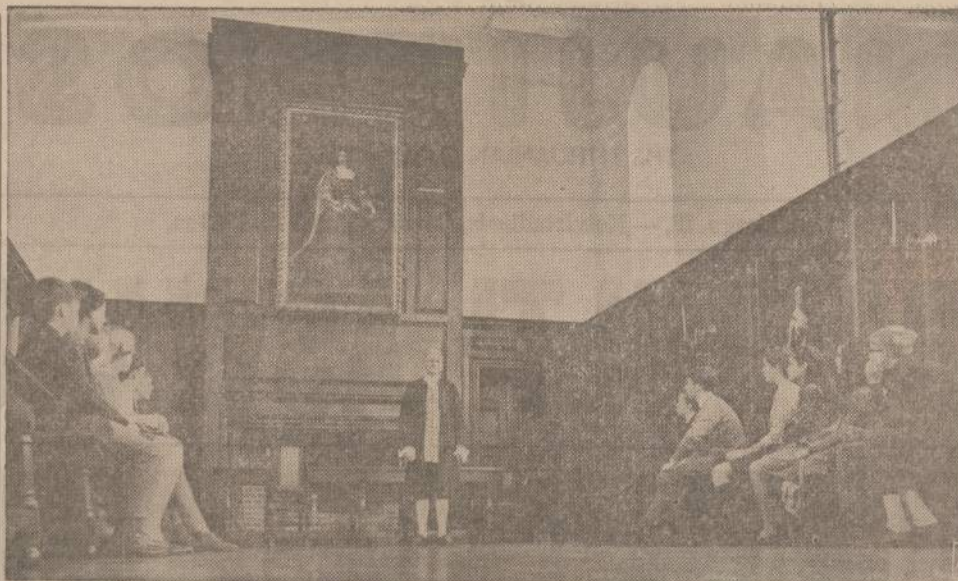
Garsaus architekto Wren statytas Williamsburgo, Virginijoje universitetas turi daug istorinių vertėjų. Pastato prižiūrėtojas aiškina studentams vienos salės istoriją. Virš jo matosi karalienės Anne paveikslas.

Rengėjai, reklaminius lapelius j visuomenę kreipdamiesi, prašo ateiti, kad neapviltume "Aukuro" pastangų. O aš sakau: neapsivilkite, gegužės 17 likdami namie, prie nuvalkiotų