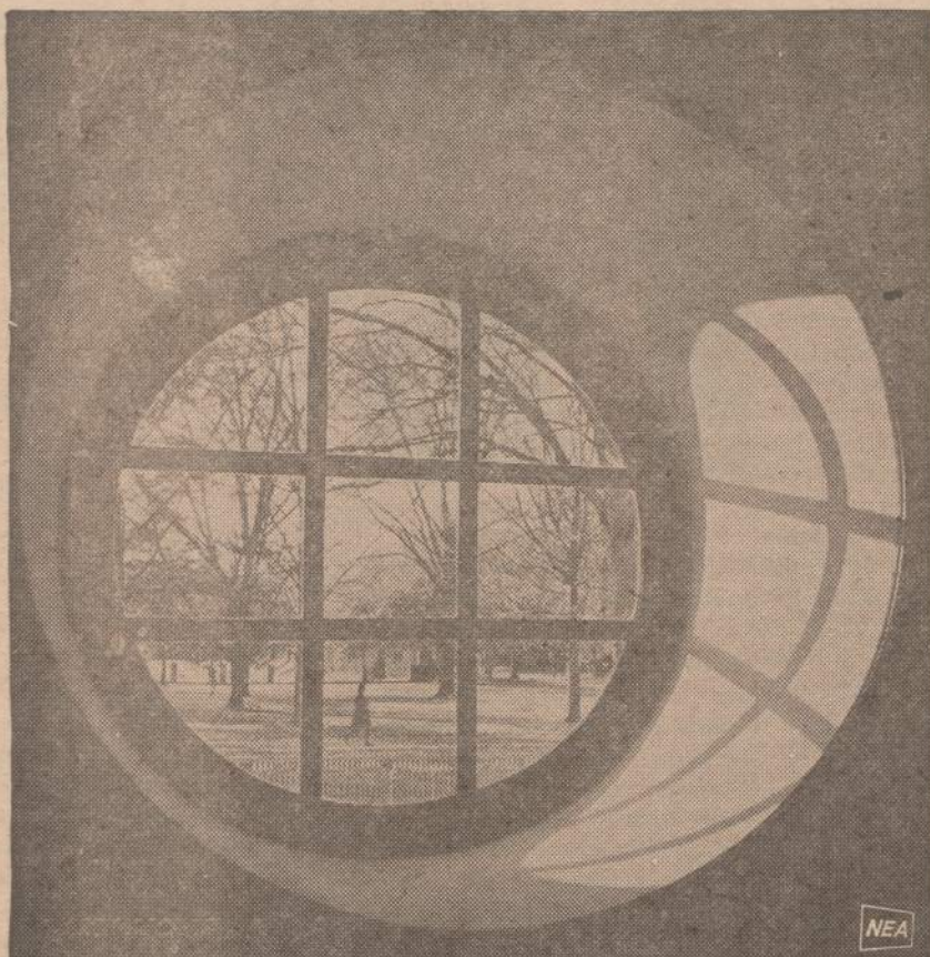
Apskritame Williama ir Marijos kolegijos lange, Williamsburge, Virginijoje matomas universiteto sodas, apšviestas pavasario saulės. Kolegija statyta 1693 metais.