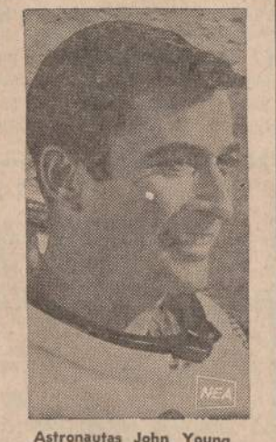
Astronautas John Young

SANTIAGO. — Čilėje vyksta savotiškas paradoksas. Galvijų Čilėje yra daug, kasmet čia paipauinama apie 350,000 vos gimusių veršiukų, nes reikia tauvų karvių pienu, kurio produktų Čilėi trūksta. Dabar mokslininkai pradėjo gaminti iš žučių miltų pienu pakeičiamą, kuris atrodo ir turi skonį, kaip pienu, o proteinu turi dar daugiau. Nežinia, ar šį produktą gers patys žmonės, ar juo šers veršius.