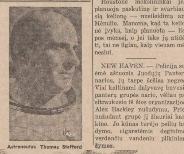
Astronautas Thomas Stafford

HOUSTONAS. — Vakar 11:39 Apollo 10 erdvėlaivis dideliu greičiu įėjo iš erdvės į Žemės atmosferą ir 11:54 Čikagos laiku, parasiutams sulėtinus kritimo greitį, nusileido į Ramųjį vandenyną, 395 mylios nuo Pagopago salos. Astronautai prieš tai pirmą kartą nusiskuto septynių dienų senumo barzdąs. Kelionė atgal buvo be jokių rūpesčių, nors grįžimas atmosferon yra viena pavojingiausių ir astronautams fiziniai daugiausia varginančių kelionės tarpų. Oro trintis labai įkaitina erdvėlaivio sienas. Parasiūtų išsiskleidimas staiga truktelėjo sklaidų lėkimą, o vandenynan atsimušimas irgi gali padaryti sužalojimų. Nemažonas ir vandens supimas, nuo kurio astronautai ne vienas suserga "jūros liga".