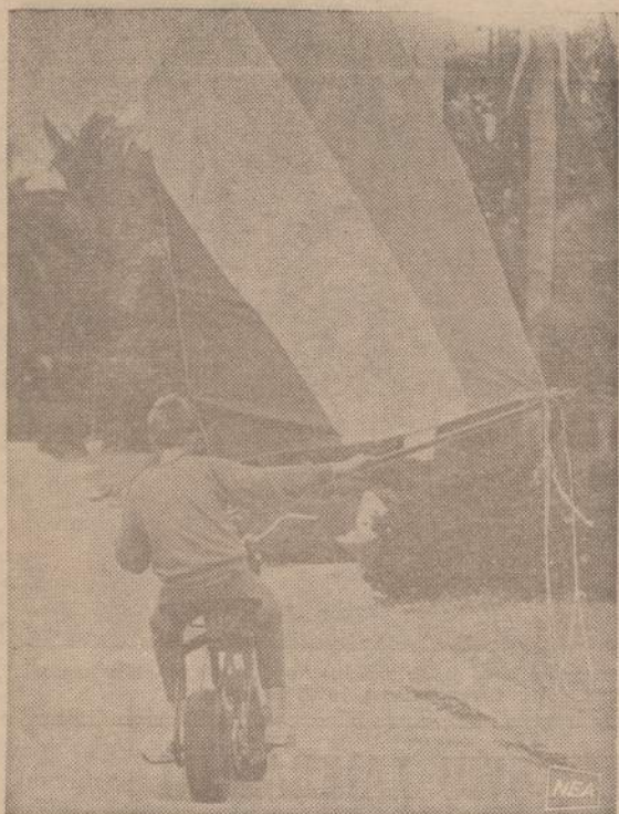
Vienas 13 metų Floridos berniukas, susiradęs motociklą be motoro, sugalvojo išeitį ir prisitaikė bures. Stipresniam vėjui papūtus, motociklas gan greit važiuoja.