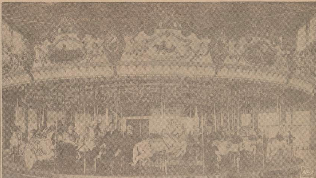
San Francisco turėjo nemažą pasilinksminimų parką, kuriame buvo ir čia matoma "puikiausia pasaulio karusėlė". Jos savininkai nusifotografavo karusėlės atidarymo dieną, prieš 60 metų.

Theresė tylutėliai dejavo: jau kelios savaitės vis jai "tasai te-