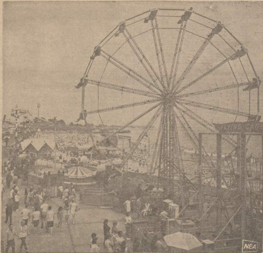
Šiais metais sukanka 100 metų Tarptautinei Pasilinksminimo Parkų Sąjungai, kuri atstovauja apie 400 tokių parkų ir jų įrengimų gamintojams visame pasaulyje.