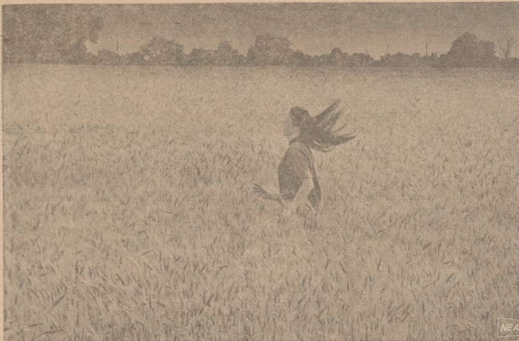
Kansas valstijoje šiais metais labai gerai auga kviečiai. Tikimasi gauti 298 bušelius derliaus. Šis kiekis būtų mažesnis tik už rekordinį 1952 metų derlių, kada kviečių Kansas buvo užauginta 308 bušeliai.