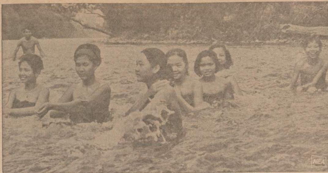
Karštą dieną Laoso gražuolės subrido į upę atsivėsinti. Toliau stovįs vyras laukia ar kuriai nenusmuks sarongas. Pasimaudžiusios merginos tais pačiais rūbais toliau žengia savo keliais.