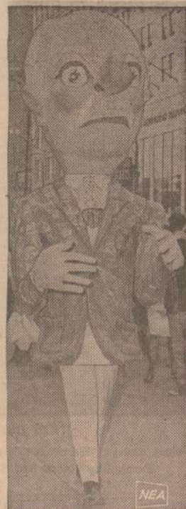
Ši kaukė sukėlė praeivių susidomė- imą New Yorko centro gatvėje. Šitaip buvo garsinama viena paroda. Vy- ro, pasislėpusio po kauke, veidas ma- tosi langelyje tuoj po kaklaraiščiu.