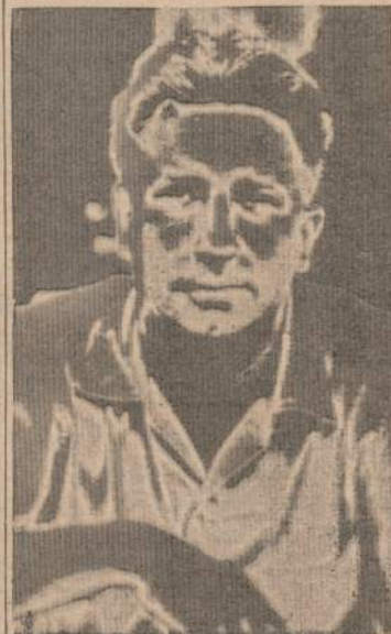
Algirdo Grigaičio foto nuotraukos fragmentas