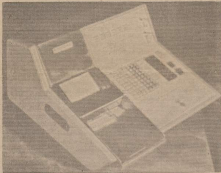
Naujausias automatinis kompiuteris

Antras svarbus prezidento pranešimas sako, kad Chicago Taupymo Bendrovė yra viena mažiausios taupymo bendrovių, turinčių 100% pilnai automatišką rekordų tvarkymo sistemą, vadinamą On Line Electronic Processing System.