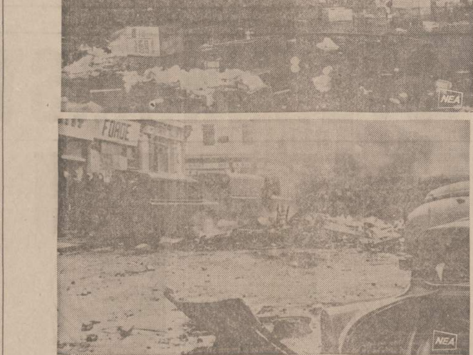
Dviejose Atlanto pusėse tuo pačiu metu įvyko riaušės. Jų padariniai vienodi. Viršuje vaizdas Passaic, N. J. gatvės, kur įvyko rasinės riaušės, o apačioje Belfasto gatvė, kur kovojo protestantai prieš katalikus.

Proto ir dvasios negalavimų požymių labai daug ir jie begaliniai įvairūs. Čia noriu paminėti keletą, kurie dažniausiai pasitaiko ir kurie gali duoti šokią tokią nuovoką kas darosi. Vienas tokių požymių - grupė angliškai vadinasi "De-