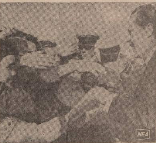
Rumunijoje tūkstančiai žmonių siekė pasisveikinti su JAV prezidentu Nixonu.