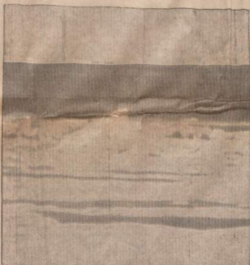
"Pasaulio pabaiga". Arktikos okeano vaizdas: ledas, vanduo ir dangus.