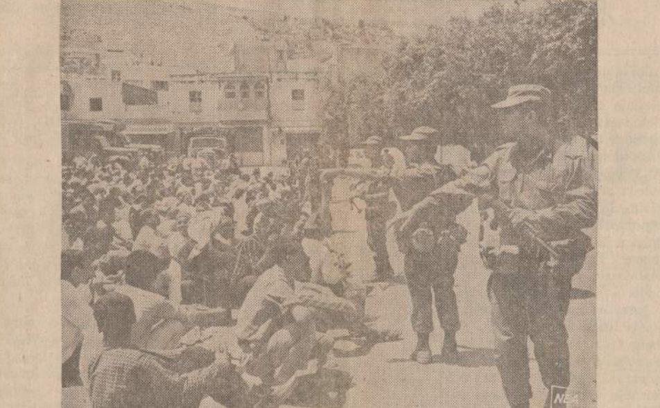
Vis dažniau kartojami sabotažo veiksmai Izraelio okupuotoje Jordanijos srityje. Praeitą antradienį įvyko didelis sprogimas. Izraelio karo policija suvarė jaunos arabus į kiemą ir stengiasi surasti sabotažo rengėjus. Kariai išviečia pas tarytoja jauną arabą, kuris turi aiškinti, kur jis buvo ir ką jis paskutinėmis dienomis darė.

Sovietinė tvarka, pasirodo, nuostabiai liberali kaip tik ten, kur praverstų gerokai daugiau drausmės. Gyvybiškai svarbių nuostatų saugotojų rankos sutirštės prieš arogantiškus jų pažeidėjus. Užtat dalykuose, kuriuose žmogui priklauso ko daugiausia laisvės, pilietis užpiudomas visagaliais čekistais, jei tik pabando nors kiek pasinaudoti jam priderančia laisve. Siems nereikia ieškoti "administracinės komisijos, kuri "sutiktų nubausti" tą, su kuriuo jie užsimoka susidoroti. (E)