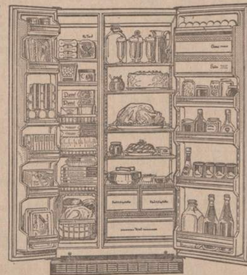
Hotpoint 21.3 cu. ft. Model CSF621K

GLASER'S FURNITURE AND APPLIANCE COMPANY