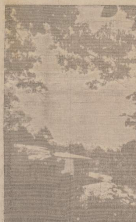
Kuo ne Riviera? Vaizdelyje matomas Michigano ežero ir paplūdimio tarpas Union Piere žiūrint nuo Gintaro kalnelio.

Rugsėjo mėnuo dar ir tuo vertas atgal įtraukti į atostogų sezoną, kadangi šį mėnesį visame Michigane yra uogų ir vaisių sezonas. Savais automobiliais ar būriais susimetę žmonės iš vasarviečių gali netoli važiavę pasiekti geriausias obuolių, kriaučių, "pyčių" ir slyvų farmas ir (nukelta į 5 psl.)