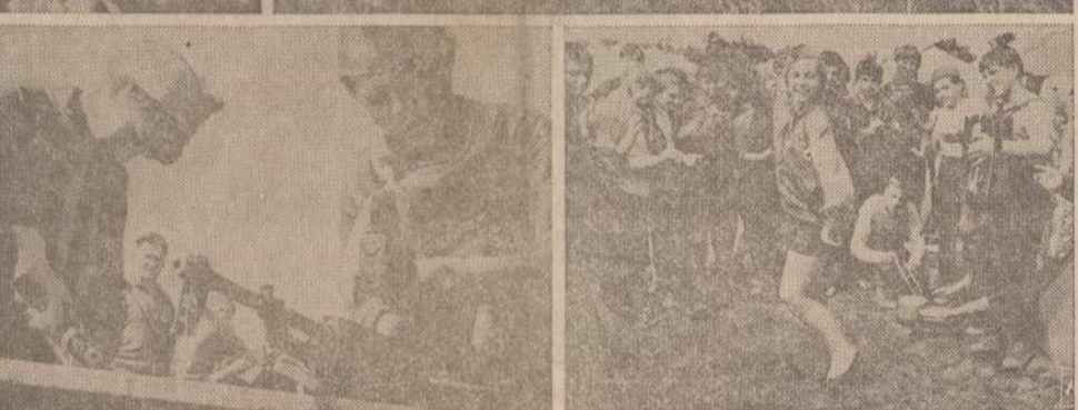
Diktatūry valdomuose kraštuose valdžios visada bando indoktrinuoti gyventojus nuo pat vaikystės. Sovietų Sąjunga turi savo "hilerjugendus", vadinamus, pionierius. Paveikluose matomi sovietų vaikai nuo pat mokyklos suolo pratinami prie ginklų, prie karinės taktikos žaidimų, išmokomi ardyti ir sudėti ginklus. Sovietų propaganda nuolat kalba apie taiką, tačiau praktikoje jau vaikus pratina prie karo.