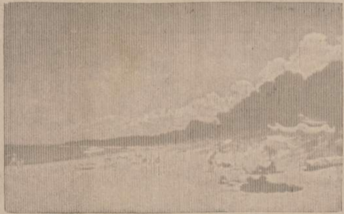
Lietuviškasis paplūdimys Union Piere.

Kodėl nepaskelbti rugsėjį viengungių mėnesių?