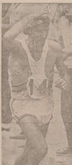
Belgu maratono bėgikas Gaston Roelants, gavinasi su vandens pilna kempine. Jis Graikijoje įvykusių Europos Lengvosios Atletikos varžybų bėgime gavo antrą vietą.

Chicago Lietuvos Golfo Klubu pirmenybės įvyko rugsėjo 21 dieną, Palos Country Club. Varžybose dalyvavo 85 žaidėjai ir