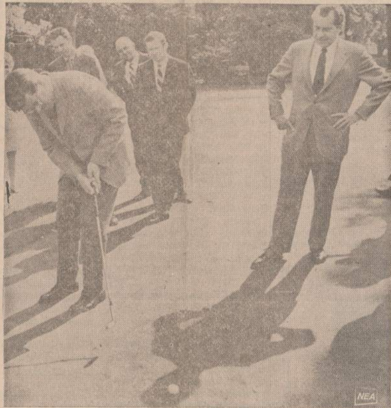
Golfo klubo instruktorius Frank Beard Baltųjų Rūmų pievelėje įkerta rutuliuką į duobelę. Kitas godus golfininkas, prezidentas Richard Nixonas, atidžiai seka instruktoriu, kad ir pats galėtų taip taikliai pataikyti. Frank Beard, dažniausias golfo premijų laimėtojas, Baltųjų Rūmų kieme nori pasirodyti ir prezidentui parodyti, kaip iš tikrųjų reikia žaisti golfą.

Valdžia palengvino draudžiamą laiką. Vakaraais dabar gatvėse galima vaikščioti iki 10 val., anksčiau buvo — iki 9 val. Anglų ir italų kalbomis užrašai Libijoje buvo labai priimti. Tripolyje eina ir keli angliškai kalbomis laikraščiai. Jiems leista eiti, tačiau svetimom kalbomis užrašai prie redakcijų nuimti. Ateityje ir pašto ženkluose bus tik arabiški užrašai. Šiuo metu "Libijos karalystė" perštamputa "Libijos Arabų Respublika" antspaudu.