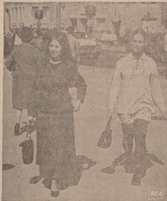
Čikagos Michigano gatvėje vyrų mėgsta stebėti praeinančias merginas. Pavėiksle matomas madu įvairumas. Pačioje kairėje moteriškė eina su vidutinio ilgio sijonu, viduryje naujas "maxi-coat", o dešinėje — jau įprastas "mini" sijonėlis.

Bolševikams Lietuvą okupavus 1940 m. nieks naujų vadovėlių nespausdino. Švietimo Ministerija pranešė panaikinti Vytį, vėlavą ir kt. Sulipinom, užlipinom, ar išplėšim ir toliau naudojom tuos pačius vadovėlius.