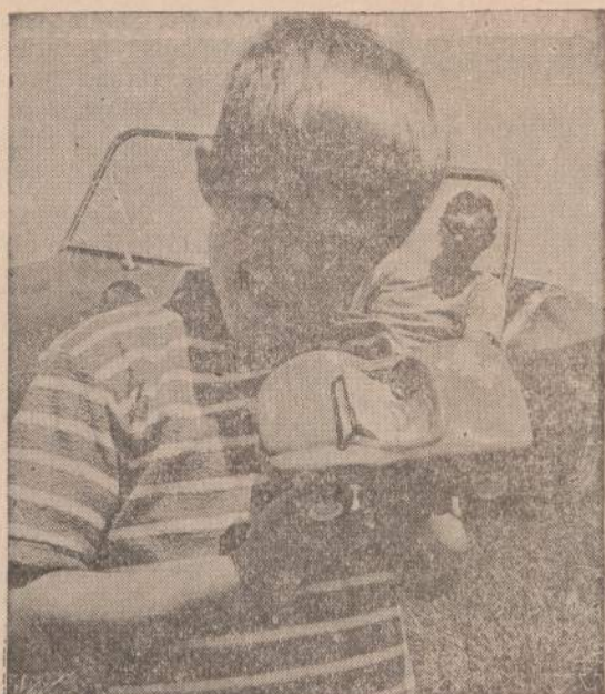
LIKE DADDY, Junior is spending more time with leisure time vehicles. As an example, Tonka's Fun Buggy is displacing traditional pick-ups and dump trucks as this year's best seller.

Pagaliau, kaip pavasaris po sunkios žiemos, prašvito Lietuvai Vasario 16-toji. Taip daug išskentėjusios Lietuvos sūnūs, išgirdo iš nelaisvės rėtelių besiveržiančios tautos šauksmą: "Lietuva pavojuje! Kas myli Lietuvą, kas trokšta laisvės, kas pajėgia valdyti ginklą, nelaukdamas nė valandos, eikime laisvės ir Tėvynės ginti! Kaip mūsų tėvai ir sentėviai, drąsiai be baimės, pirmi užstokime priešams kelią! Pakelkim žygi už mūsų motiną Tėvyne, už Lietuvą!" Kas tik galėjo pakel-