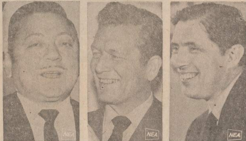
Mario Procaccino John Lindsay John Marchi Šių metų lapkričio 4 d. rinkimuose svarbiausios varžybos įvyks New Yorke, kur dėl mero vietos varžosi trys kandidatai: Mario Procaccino, John Lindsay ir John Marchi.

bar jis savo rajone tegavo 3,063 balsus, kai jaunas konkurentas surinko 15,200 balsus.