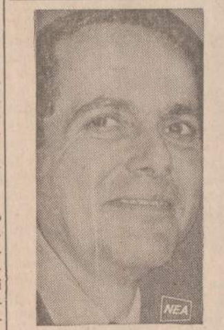
Naujas Atlanto miesto mēras Sam Massell. Sakoma, kad Atlanta yra tikrai integruotas miestas, nes mēnėtas mēras yra žydas, o jo padėjėjas Maynard Jackson — negras.

Arabų partizanai Lebane laikosi atokiai nuo vietinių gyventojų, neprašo jų maisto, nei na į jų namus. Užimtame kaimo Yantoje partizanai įsitvirtinę epkausose, tačiau Lebano vėliava palikta ant policijos būstinės stogo.