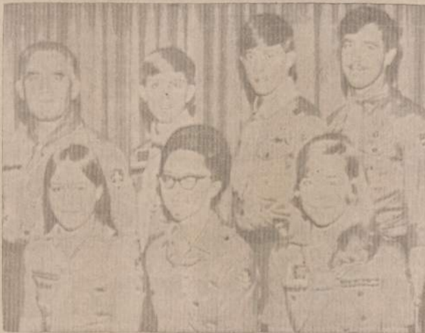
LIETUVIŠKAS IR SKAUTISKAS SIETYNAS

Skautiškoms šeimoms laikome, jei jos narių dauguma yra skautai-ės. Miela būtų įdėti į spaudą ir daugiau tokių šeimų nuotraukų, bet jų, deja, foto korespondentai nepagauna.