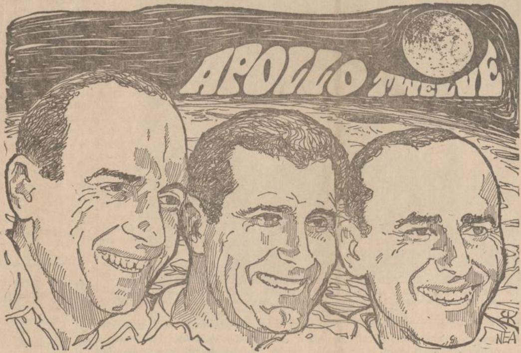
Trys Apollo 12 astronautai ateinantį penktadienį, lapkričio 14 dieną pradeda rizikingą kelionę į Mėnulį

Šį rudenį Italijoje baigiasi ir daugiau darbo sutarčių. Unijos — komunistų vadovaujamas ir demokratų rankose — varžosi tarp savęs, kuri daugiau laimės.